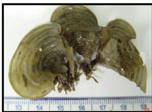
Gambar 2. Morfologi Padina sp dari Perairan Pulau Lombok.

Selain dari warna talus, karakter lain dari Padina sp yang cukup beragam adalah ukuran talus, baik lebar maupun ketebalan (Benita et al. , 2018). Padina sp yang ditemukan di Perairan Pulau Lombok memiliki tinggi, tebal, dan lebar talus yang bervariasi (Gambar 2). Tinggi dan lebar talus merupakan karakteristik untuk spesies Padina sp , namun ada juga yang terjadi akibat pengaruh lingkungan. Padina sp dari spesies yang sama pada perairan yang berbeda kondisi lingkungannya, akan menghasilkan ukuran yang berbeda, meskipun umurnya sama (Herbert et al. , 2016).