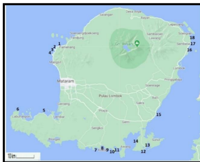
Gambar 1. Lokasi Sampling Kekerabatan Alginofit di Perairan Pulau Lombok. 1) Teluk Nare; 2) Mentigi; 3) Kecinan; 4) Malimbu; 5) Gili Genting; 6) Bangko-bangko; 7) Mawun; 8) Kuta; 9) Tanjung Ann I; 10) Tanjung Ann II; 11) Teluk Bumbang; 12) Ujung Mas; 13) Serewe; 14) Ekas; 15) Rambang; 16) Transad; 17) Labuhan Pandan; dan 18) Pulur.

Pengambilan sampel dilakukan pada tempat tumbuh Padina sp dalam bentuk utuh dan masih hidup. Selanjutnya, rumput laut yang diperoleh didokumentasikan. Setelah itu, dilakukan karakterisasi morfologi untuk mendapatkan data tentang karakter morfologi yang diperlukan untuk analisis kekerabatan. Karakter yang diamati meliputi bagian holdfast , talus, serta bagian folioid. Data morfologi meliputi warna, ukuran, serta jumlah dari masing-masing karakter yang diamati. Metode penelitian mengacu pada Warhamni et al. (2013) yang telah dimodifikasi.