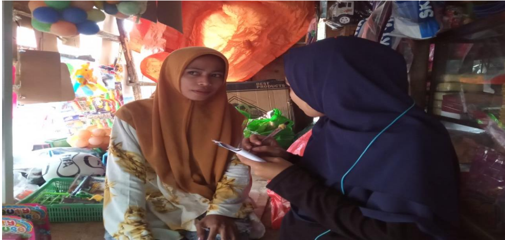
Gambar 2. Wawancara dengan anak putus sekolah tingkat SMA.