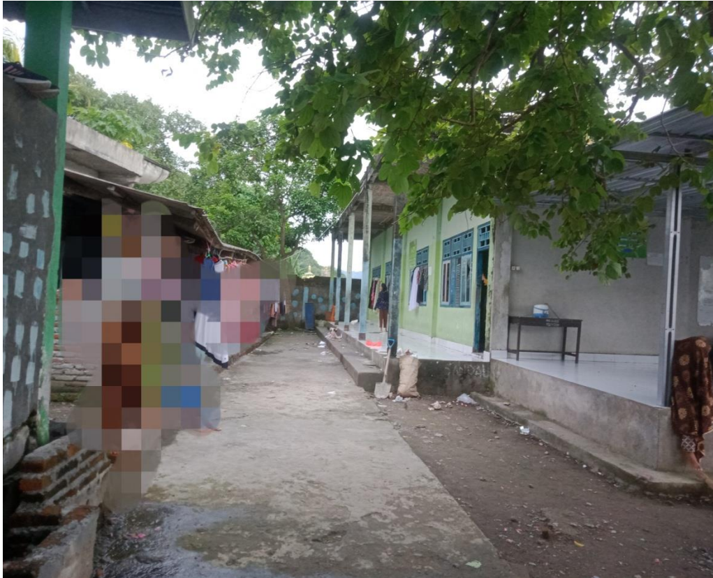
Asarama Putrid Sekaligus Majelis Ta'lim