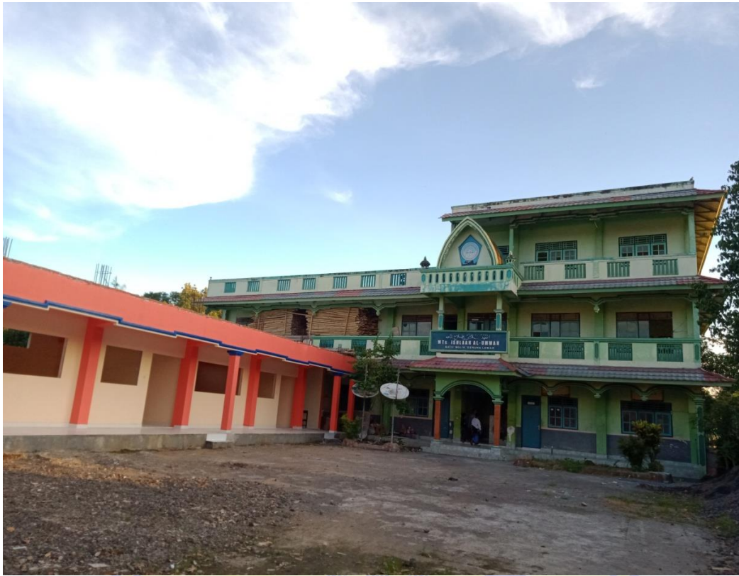
Madrasah Stanawiyah Ishkaah Al Ummah Tanpak dari depan