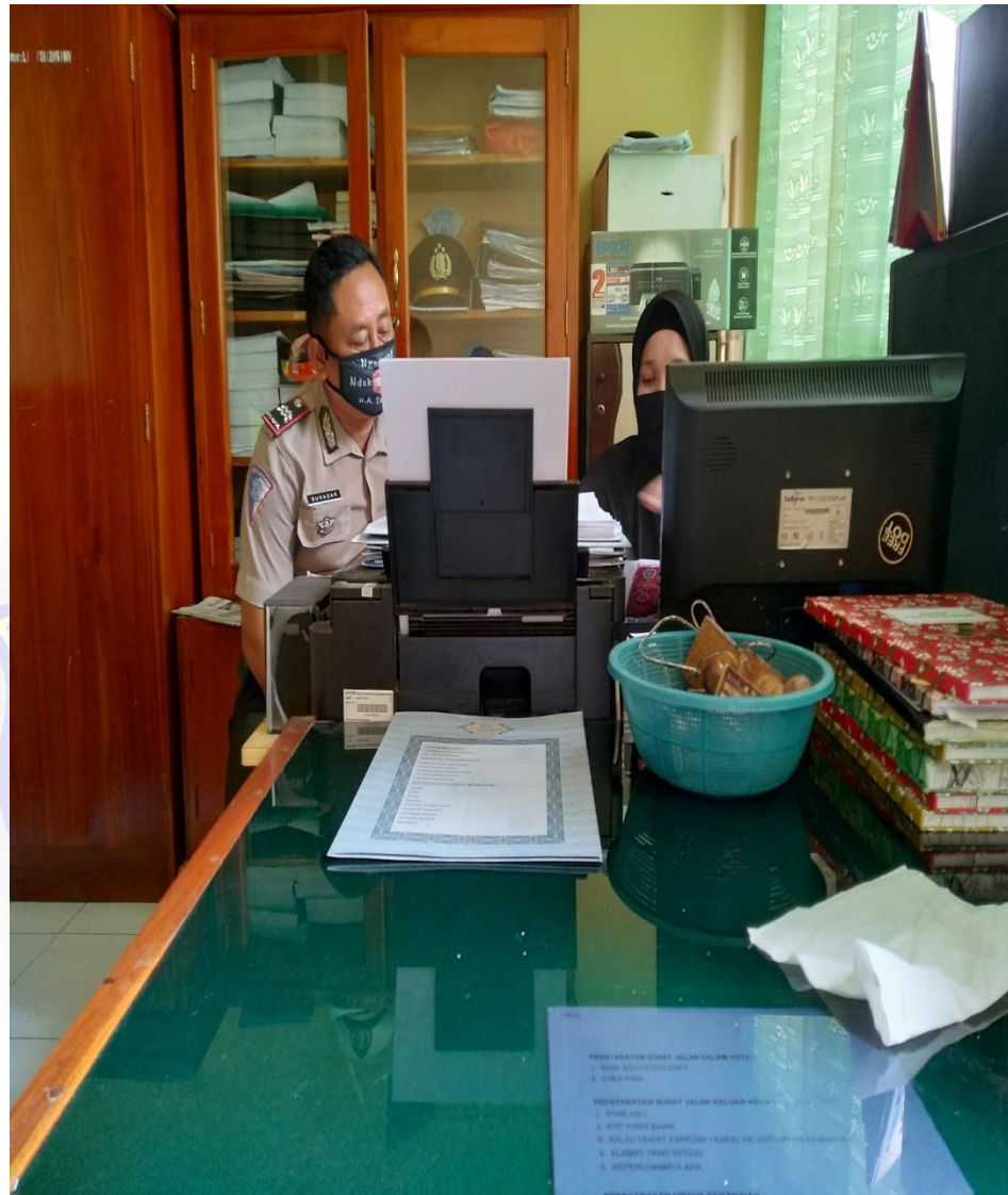
Gambar 1 : Pemberian Surat Ijin Penelitian di Kantor Polres Bima Kota