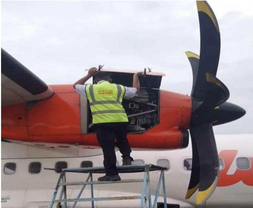
Gambar mesin pesawat yang mengalami kerusakan