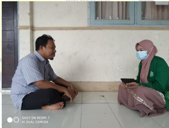
SUMBER. Wawancara dengan pimpinan pondok pesantren darul hikmah – Mataram. Santri wandan santriwati dokumentasikan tanggal 15 Juli 2020.