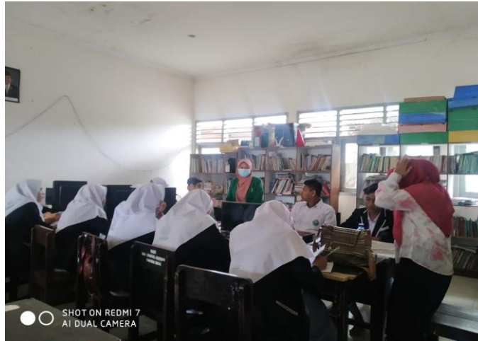
Sumber. Wawancara dengan pimpinan pondok pesantren darul hikmah- kota mataram. Santriwan santriwati sekaligus mengamati penggunaan internet dalam proses pembelajaran