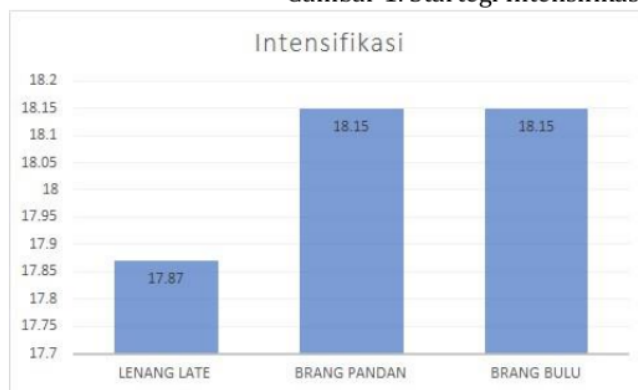
Gambar 1. Strategi Intensifikasi

Mencermati Gambar 1 strategi intensifikasi dalam kehidupan masyarakat berkelanjutan pada masa Covid-19 tertinggi terdapat di Dusun Brang Pandan dan Brang Bulu rata-rata mencapai 18,15 dan paling rendah di miliki pada Dusun Brang Late mencapai 17,87. Tingkat strategi intensifikasi melalui pemanfaatan lahan pertanian yang ada, pemanfaatan pekarangan dan penambahan lahan garapan sebagai strategi bertahan hidup menuju penghidupan berkelanjutan pada masa Covid-19. Pemanfaatan lahan pekarangan sebagai alternatif dalam bertahan hidup di masa Covid-19 masyarakat sekitar Amal Usaha Muhammadiyah.