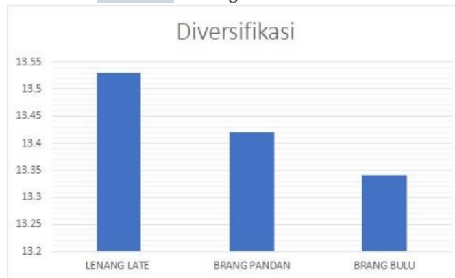
Gambar 2. Strategi Diversifikasi

Mencermati Gambar 2 strategi diversifikasi dalam kehidupan masyarakat berkelanjutan pada masa Covid-19 tertinggi terdapat di Dusun Lenang Late rata-rata mencapai 18,15 dan paling rendah di miliki pada Dusun Brang Bulu mencapai 13,30. Tingkat strategi diversifikasi melalui pengolahan hasil pertanian dan luar pertanian sebagai strategi bertahan hidup menuju penghidupan berkelanjutan pada masa Covid-19. Pertanian sebagai salah satu penghasilan utama masyarakat Desa Seloto sehingga masyarakat sekitar Amal Usaha Muhammadiyah.