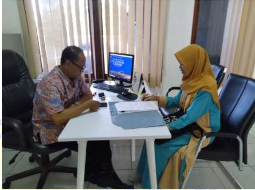
FOTO KEGIATAN WAWANCARA DI PT. TASPEN CABANG MATARAM