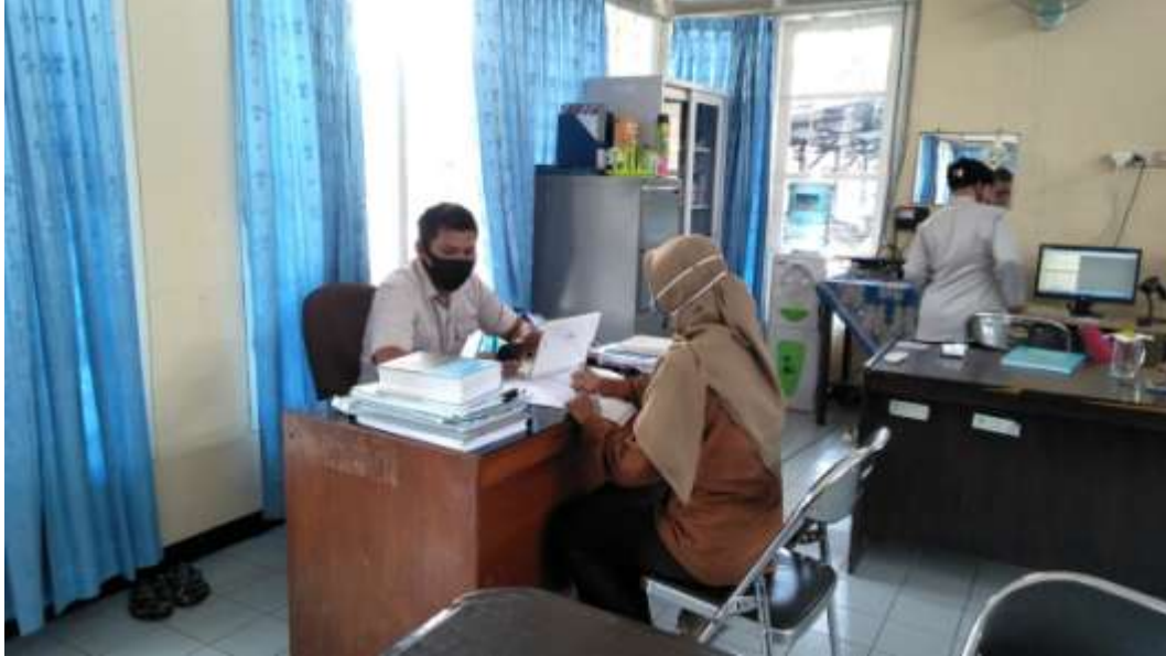
Proses Wawancara Kepala Perpustakaan