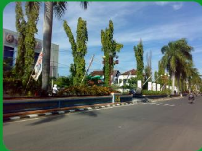
MEDIAN JALAN ADI SUCIPTO