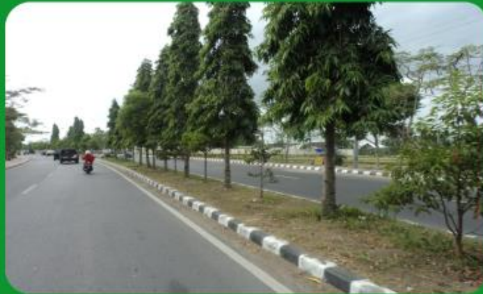
MEDIAN JALAN ARYA BANJAR GETAS