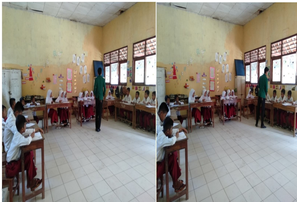
Foto Tes Awal Kelas Kontrol