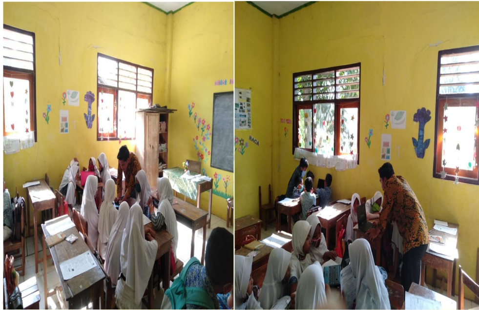
Foto Penelitian Kelas Kontrol