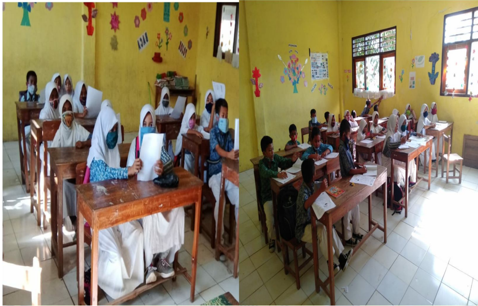
Foto Tes Akhir Kelas Kontrol