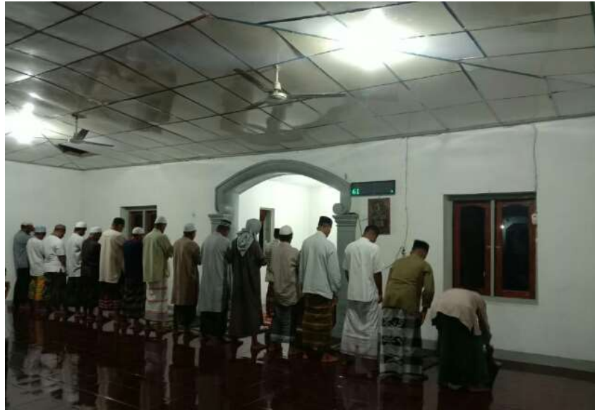
Gambar 4. Aktivitas Sholat Berjamaah di Masjid Nurul Ittihad Maukeo