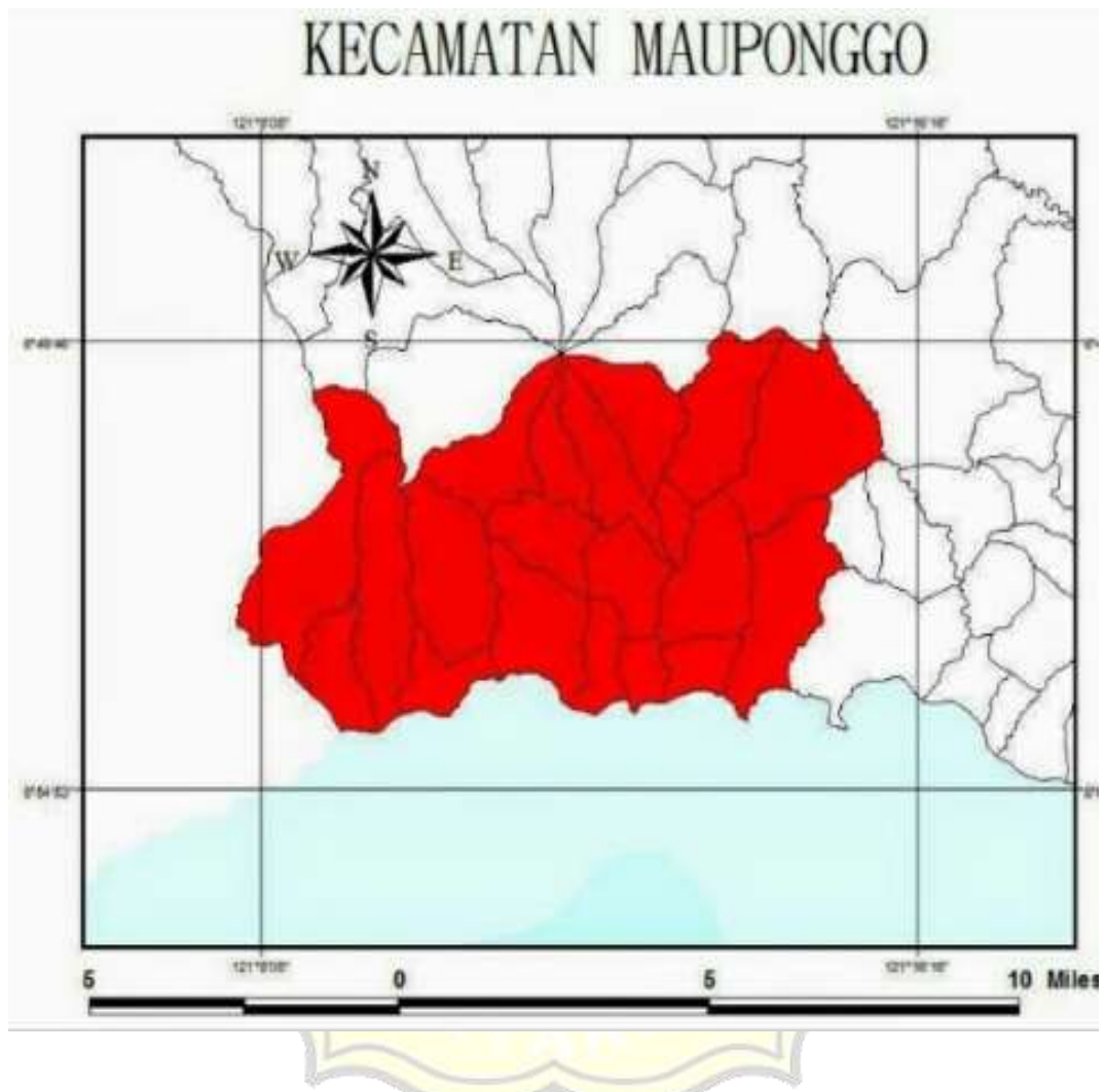
Gambar 1. Peta Wilayah Kecamatan Mauponggo