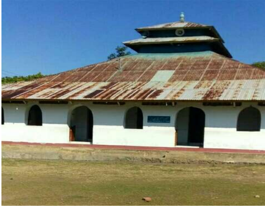
Gambar 2. Masjid Nurul Ittihad Desa Wolotelu