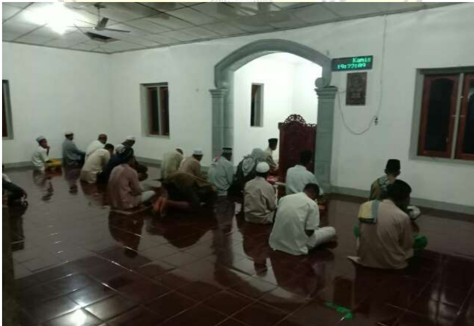
Gambar 3. Suasana Sholat Berjamaah di Masjid Nurul Ittihad Maukeo