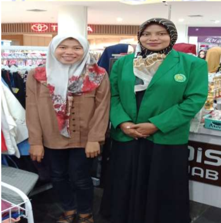
Wawancara dengan ZA, Pengunjung LEM