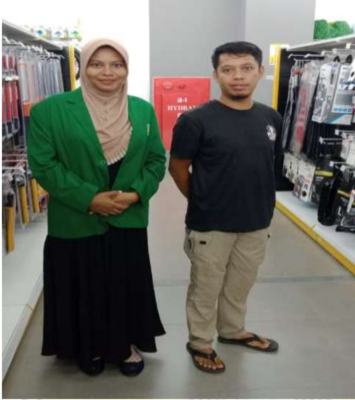
Wawancara dengan DA, Pengunjung LEM