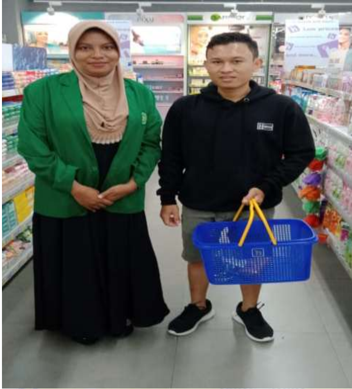
Wawancara dengan FA, Pengunjung LEM