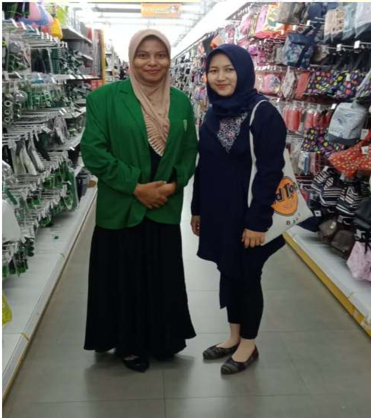
Wawancara dengan MO, Pengunjung LEM