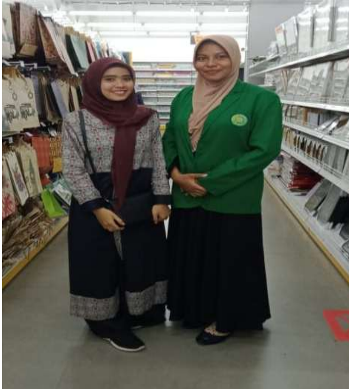
Wawancara dengan AR, Pengunjung LEM