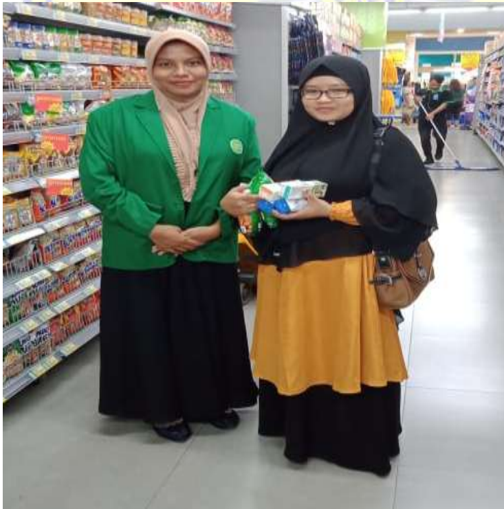
Wawancara dengan TA, Pengunjung LEM