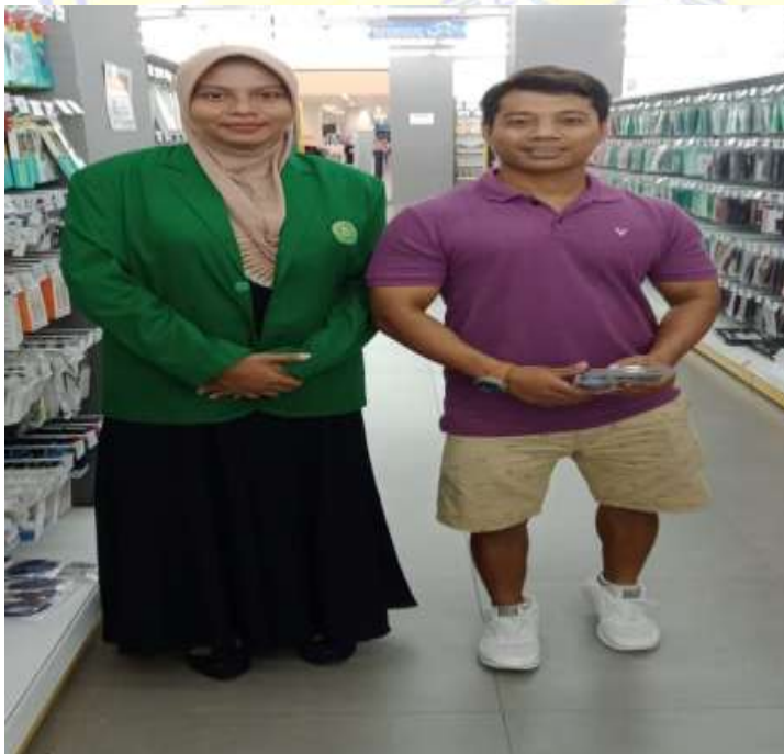
Wawancara dengan MI, Pengunjung LEM