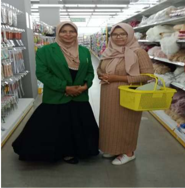
Wawancara dengan RH, Pengunjung LEM