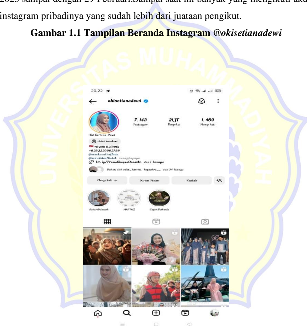
Gambar 1.1 Tampilan Beranda Instagram @okisetianadewi

Dari hasil pengamatan, maka penulis tertarik menganalisis isi pesan dakwah terhadap postingan dakwah pada akun Instagram Ustadzah @okisetianadewi penulis memilih akun tersebut karena beliau mulai berkarir sebagai artis dan menjadi seorang pendakwah sampai saat ini.