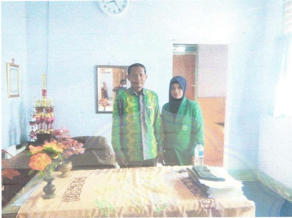
Gambar 1: Kepala Sekolah