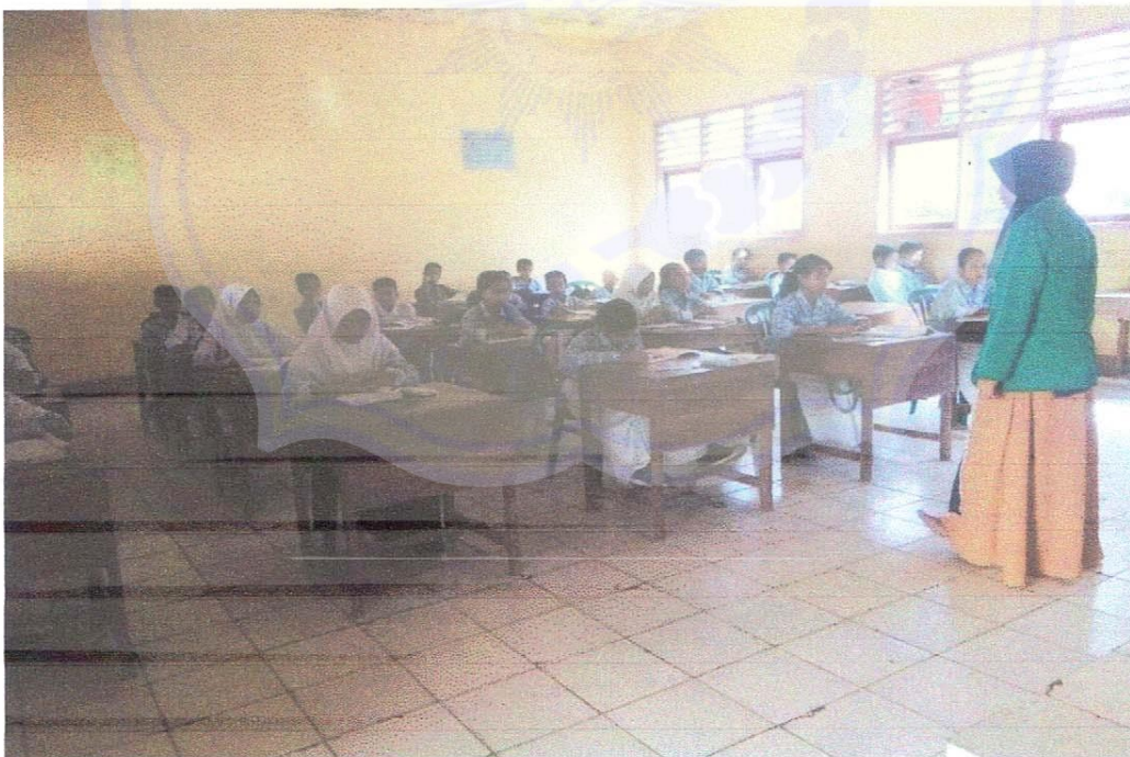
Gambar 4: Bersama Siswa