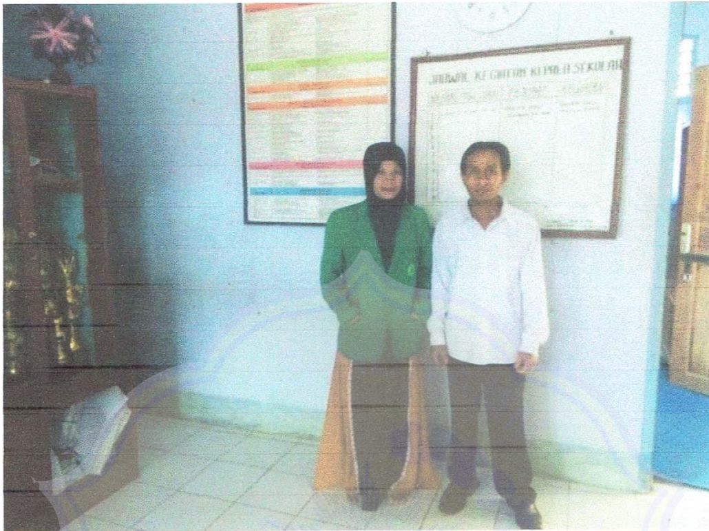
Gambar 2: Bersama Guru BK