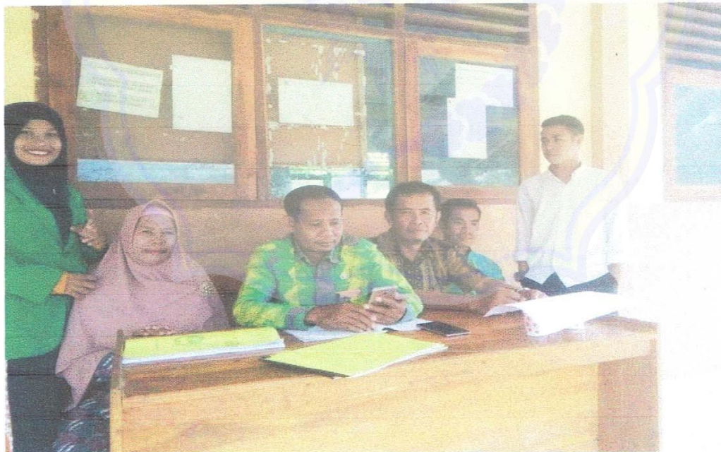
Gambar 2: Bersama Guru PPKn