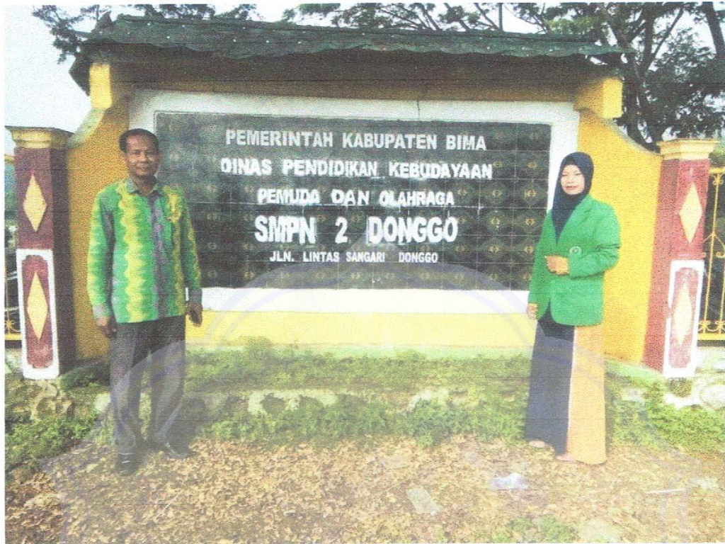
Gambar 5: Depan Sekolah