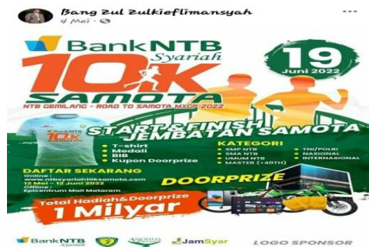
Gambar 7. Informasi Jalan Sehat

Gambar di atas menjelaskan bahwa melalui platform MSF Bang Zul Zulkieflimasyah hendak memberikan informasi jalan sehat menuju lokasi Samota MXGP. Informasi tersebut mengandung ajakan kepada masyarakat untuk ikut berpartisipasi dalam kegiatan jalan sehat dan sekaligus mengandung promosi arela Samota MXGP.