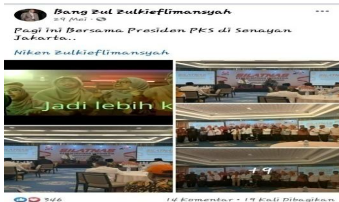
Gambar 15. Silatnas PKS di Senayan Jakarta