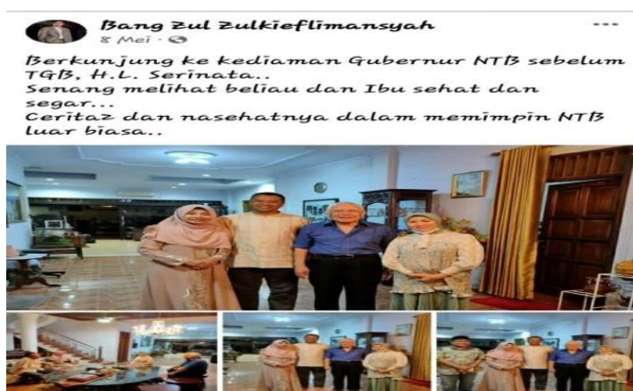
Gambar 11. Bertemu Mantan Gubernur NTB

Bertemu dengan tokoh yang dimaksud adalah suatu momentum dimana seorang pejabat publik menjumpai seorang tokoh. Dalam konteks ini, WPV tentang pertemuan dengan tokoh disosialisasikan melalui platform MSF Bang Zul Zulkieflimansyah. Ada 17 WPV tentang pertemuan dengan tokoh, yang diposting oleh Bang Zul Zulkieflimansyah pada platform MSF, salah satunya di bawah ini.