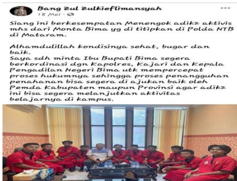
Gambar 14. Peristiwa Hukum

Pada gambar di atas terlihat Gubernur Nusa Tenggara Barat sedang duduk di tengah-tengah pemuda berpakaian seragam tahana warna merah. Dalam teks yang menyertai foto di atas terdapat keterangan yang menjelaskan bahwa Gubernur NTB sedang menjumpai (menengok) mahasiswa yang ditahan di Polda NTB. Para mahasiswa yang dijumpai itu adalah para demonstran. Bahkan, dalam gambar di atas dapat diperoleh informasi bahwa motif kedatangan Gubernur NTB untuk memastikan mahasiswa dalam kondisi sehat, dan mengupayakan penyelesaian masalah hukum.