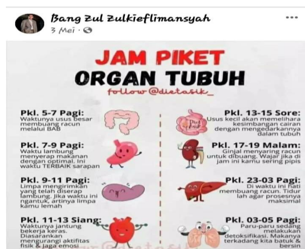
Gambar 6. Informasi Kesehatan

Informasi kesehatan yang dimaksud adalah bentuk ekspresi yang memuat perihal tentang kesehatan yang disampaikan secara lisan atau tertulis. Dalam konteks ini ekspresi informasi kesehatan adalah berupa tulisan, gambar, atau video dalam WPV pada platform MSF. Ada 2 (Dua) WPV tentang informasi kesehatan yang diposting melalu platform MSF, salah satunya berikut ini.