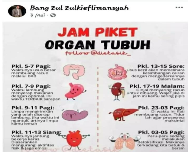
Gambar 6. Informasi Kesehatan

Dalam gambar di atas, platform MSF Bang Zul Zulkieflimansyah memposting informasi kesehatan tentang aktifitas organ tubuh. Postingan tersebut hendak mengungatkan agar netizen (warga medsos) dapat beraktifitas secara proporsional dengan mempertimbangkan waktu dan kinerja organ tubuh. Informasi seperti ini merupakan literasi informasi kesehatan dengan maksud agar masyarakat berupaya meningkatkan kualitas dan gaya hidup (Prasanti & Fuady, 2017). Hal ini juga didukung oleh pandangan, bahwa realitas ekspresi dapat dipertegas dengan memvisualisasikan suatu objek (Mukhlisin, Kusri, & Wulandari, 2023).