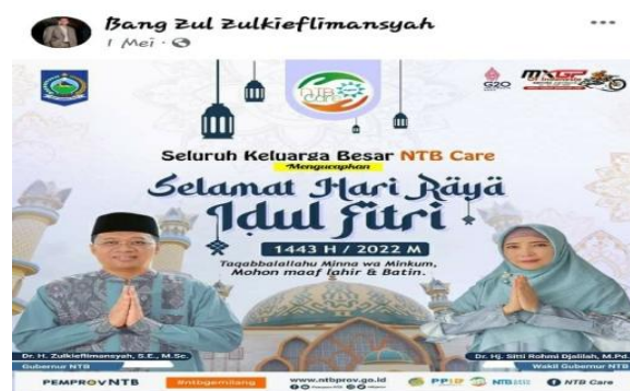
Gambar 3. Ucapan Selamat Hari Raya Idul Fitri

Dalam WPV di atas diposting pada platform MSF Bang Zul Zulkieflimansyah untuk menyapa masyarakat. Dalam postingan tersebut Gubernur dan Wakil Gubernur Nusa Tenggara Barat menyapa masyarakat dengan mengatasnamakan keluarga besar NTB Care. Apa yang dilakukan oleh pejabat publik itu tidak sekedar bermakna menyapa namun juga berarti memberi salam kekerabatan dalam upaya menunjukkan sikap kesolehan social (Fatimah et al., 2022; Marnita, 2022; Rasmi, 2022).