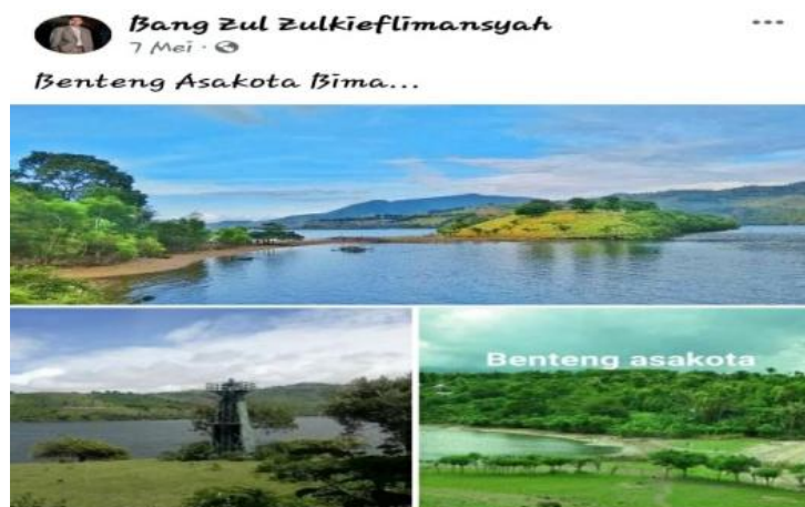
Gambar 9. Objek Wisata Benteng Asakota

Dari gambar postingan di atas, diperoleh informasi tentang keindahan objek wisata pantai. Gambar objek wisata tersebut diposting beserta teks sebagai keterangan identitas objek wisata tersebut, yaitu “Benteng Asakota” yang berada di Bima. Dengan demikian, informasi tersebut mengandung promosi sekaligus ajakan untuk berkunjung ke sana. Ajakan tersebut umumnya berdasarkan kenangan, pengalaman berkunjung yang kemudian diwujudkan dalam bentuk wacana tutur (Idawati, 2020; Mekarini, 2021)