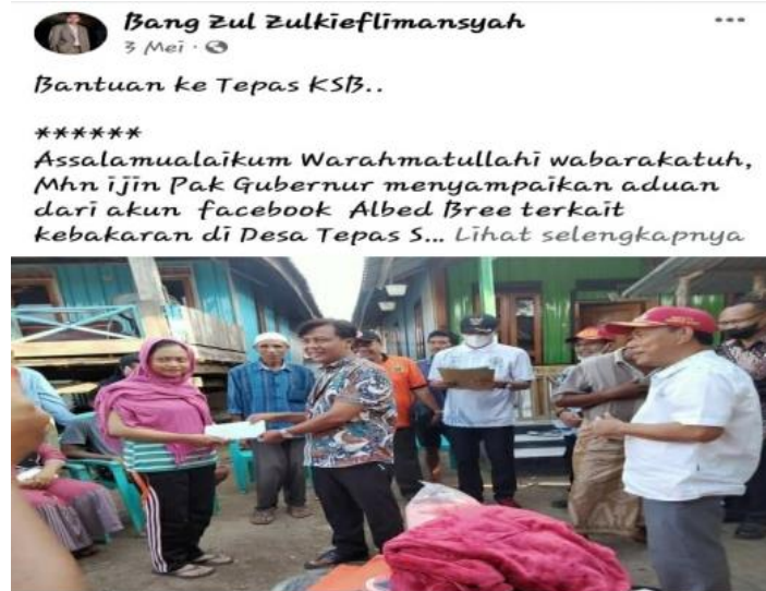
Gambar 5. Respon Bencana

Gambar di atas menjelaskan tentang kegiatan sosial dalam momentum respon bencana yang dialami oleh masyarakat Tepas Kabupaten Sumbawa Barat. Respon bencana diekspresikan melalui kegiatan pemberian bantuan terhadap korban. Melalui platform MSF Bang Zul Zulkieflimansyah juga menginformasikan bahwa respon bencana tersebut dilakukan atas dasar laporan dari akun facebook atas nama Albed Bree yang disampaikan (diteruskan) oleh netizen lain melalui platform MSF.