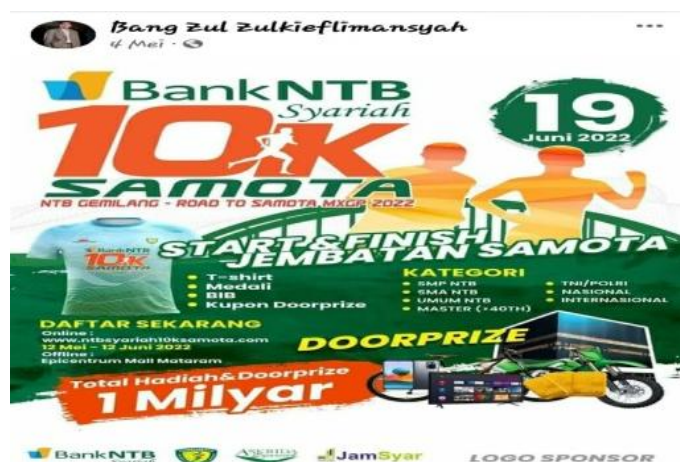
Gambar 7. Informasi Jalan Sehat

Informasi olah raga adalah segala ekspresi yang dituturkan, ditulis, maupun dalam bentuk tindakan (perbuatan) perihal olah raga. Dalam konteks ini informasi olah raga adalah WPV berupa tulisan, gambar, atau video pada platform MSF. Ada 2 (Dua) WPV yang diposting melalui platform MSF yang merupakan informasi olah raga, salah satunya berikut ini.