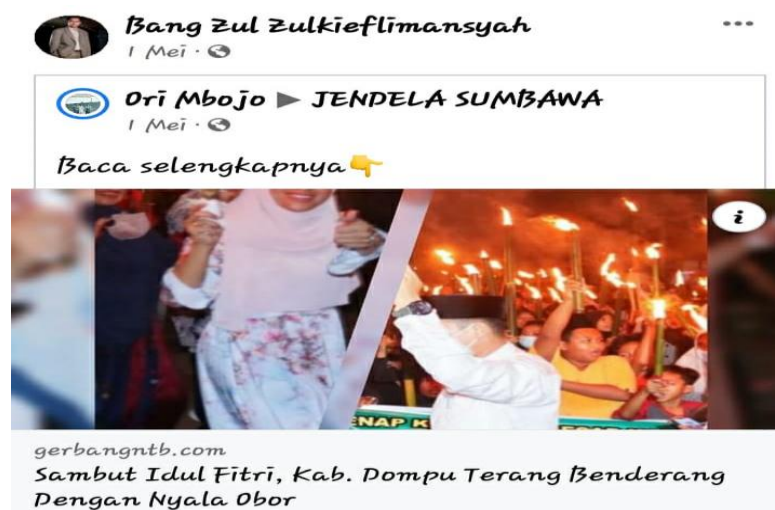
Gambar 1. Budaya Penyambutan Hari Raya Idul Fitri

Pada gambar di atas menunjukkan bahwa pejabat publik Gubernur Nusa Tenggara Barat melalui platform MSF memposting berita momentum penyambutan hari raya Idul Fitri di kabupaten Dompu. Postingan tersebut merupakan bentuk ekspresi yang apresiasi kebudayaan masyarakat.