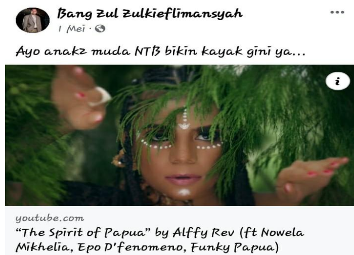
Gambar 4. Motivasi dan Apresiasi Karya Kreatif

Memberikan motivasi dan apresiasi adalah wujud ekspresi yang realisasikan melalui wacana yang ditulis atau dilisankan. Dalam konteks ini, memberikan motivasi dan apresiasi melalui WPV dalam platform MSF direalisasikan dalam bentuk teks dan disertai dengan gambar atau video. Ada 6 (Enam) WPV tentang memberikan motivasi dan apresiasi yang diposting melalui platform MSF. Berikut ini salah satu contoh ekspresi berupa memberikan motivasi dan apresiasi pada platform MSF Bang Zul Zulkieflimansyah.