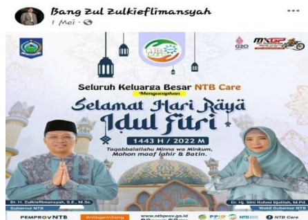
Gambar 3. Ucapan Selamat Hari Raya Idul Fitri

Menyapa masyarakat adalah perwujudan dari ekspresi yang direalisasikan dalam bentuk wacana tulisan, gambar, atau ucapan yang dalam hal ini disampaikan secara virtual melalui platform MSF. Wujud ekspresi ini disampaikan hanya dengan tujuan menyapa masyarakat, mengucapkan selamat dalam momentum hari raya atau lainnya, dan ucapan duka dan sejenisnya. Ada 8 (Delapan) WPV tentang menyapa masyarakat yang diposting melalu platform MSF. Berikut ini adalah salah satu postingan untuk menyapa masyarakat yang dimaksud.