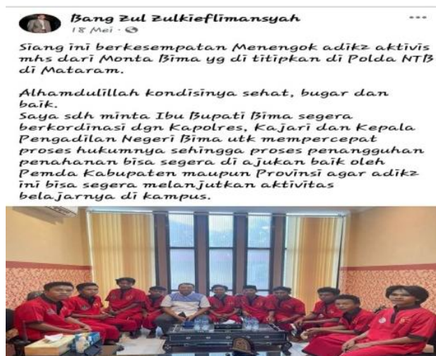
Gambar 14. Peristiwa Hukum

Pada gambar di atas terlihat Gubernur Nusa Tenggara Barat sedang duduk di tengah-tengah pemuda berpakaian seragam tahana warna merah. Dalam teks yang menyertai foto di atas terdapat keterangan yang menjelaskan bahwa Gubernur NTB sedang menjumpai (menengok) mahasiswa yang ditahan di Polda NTB. Para mahasiswa yang dijumpai itu adalah para demonstran. Bahkan, dalam gambar di atas dapat diperoleh informasi bahwa motif kedatangan Gubernur NTB untuk memastikan mahasiswa dalam kondisi sehat, dan mengupayakan penyelesaian masalah hukum. Apa yang dilakukan oleh pejabat publik tersebut adalah salah satu bentuk penanganan masalah secara persuasif dan penyelesaian secara damai (Fairuzia & Velentina, 2022).