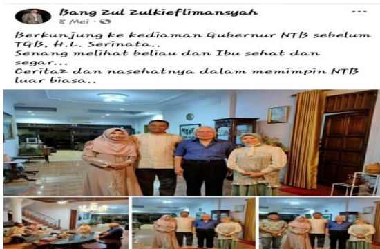
Gambar 11. Bertemu Mantan Gubernur NTB

Bertemu dengan tokoh yang dimaksud adalah suatu momentum dimana seorang pejabat publik menjumpai seorang tokoh. Dalam konteks ini, WPV tentang pertemuan dengan tokoh disosialisasikan melalui platform MSF Bang Zul Zulkieflimansyah. Ada 17 WPV tentang pertemuan dengan tokoh, yang diposting oleh Bang Zul Zulkieflimansyah pada platform MSF, salah satunya di bawah ini.