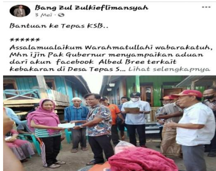
Gambar 5. Responss Bencana

Kegiatan respons bencana adalah wujud ekspresi sosial berupa tindakan dan atau tuturan yang bersifat reflektif dalam rangka respons bencana (masalah), Dalam konteks ini kegiatan respons bencana diwujudkan dalam bentuk WPV berupa gambar kegiatan dan teks yang diposting melalui platform MSF. Ada 13 (Tiga Belas) WPV tentang respons bencana yang diposting melalu platform MSF, salah satunya berikut ini.