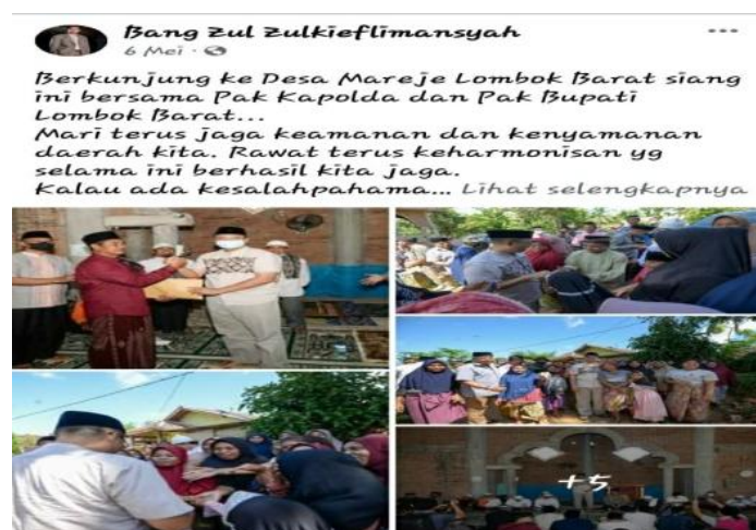
Gambar 8. Kunjungan di Desa Mareje Lombok Barat

Informasi menghadiri kegiatan merupakan wujud ekspresi partisipasi dalam kegiatan masyarakat atau kelompok masyarakat. Dalam konteks ini adalah berupa WPV berupa informasi menghadiri kegiatan yang diposting pada platform MSF. Ada 41 (Empat Puluh Satu) WPV tentang informasi menghadiri kegiatan yang diposting melalu platform MSF yang merupaka informasi menghadiri kegiatan, salah satunya berikut ini.