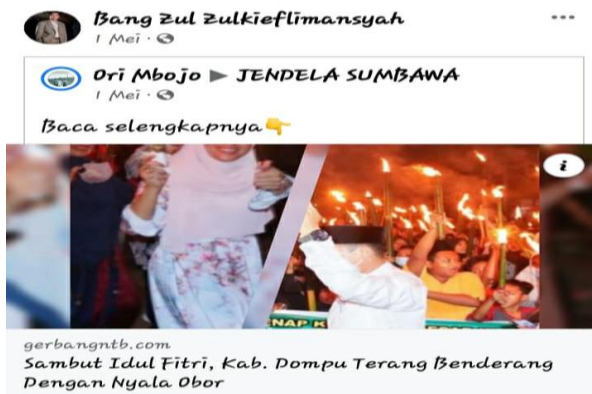
Gambar 1. Budaya Penyambutan Hari Raya Idul Fitri

Pada gambar di atas menunjukkan bahwa pejabat publik Gubernur Nusa Tenggara Barat melalui platform MSF memposting berita momentum penyambutan hari raya Idul Fitri di kabupaten Dompus. Postingan tersebut merupakan bentuk ekspresi yang apresiasi kebudayaan masyarakat.