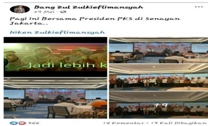
Gambar 15. Silatnas PKS di Senayan Jakarta