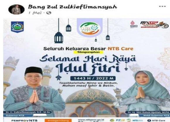
Gambar 3. Ucapan Selamat Hari Raya Idul Fitri

Menyapa masyarakat adalah perwujudan dari ekspresi yang direalisasikan dalam bentuk wacana tulisan, gambar, atau ucapan yang dalam hal ini disampaikan secara virtual melalui platform MSF. Wujud ekspresi ini disampaikan hanya dengan tujuan menyapa masyarakat, mengucapkan selamat dalam momentum hari raya atau lainnya, dan ucapan duka dan sejenisnya. Ada 8 (Delapan) WPV tentang menyapa masyarakat yang diposting melalu platform MSF. Berikut ini adalah salah satu postingan untuk menyapa masyarakat yang dimaksud.