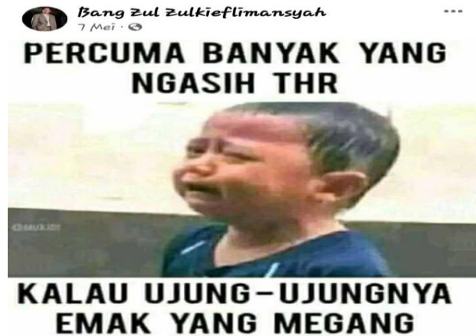
Gambar 10. Lelucon THR

Gambar dan teks yang ada pada postingan tersebut di atas mengandung unsur lucu dan menghibur. Postingan tersebut hanyalah berupa satire yang menggambarkan fenomena pada momentum hari raya, yaitu bahwa ada suasana kebahagiaan dan fenomena lucu yang menyertai.