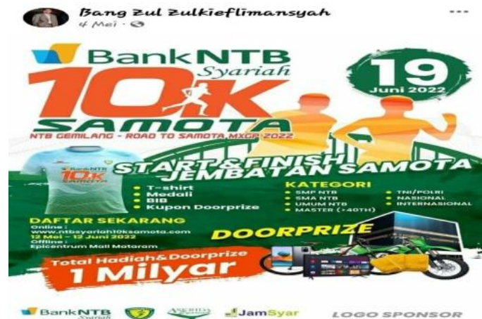
Gambar 7. Informasi Jalan Sehat

Gambar di atas menjelaskan bahwa melalui platfor MSF Bang Zul Zulkieflimansyah hendak memberikan informasi jalan sehat menuju lokasi Samota MXGP. Informasi tersebut mengandung ajakan kepada masyarakat untuk ikut berpartisipasi dalam kegiatan jalan sehat dan sekaligus mengandung promosi arela Samota MXGP.