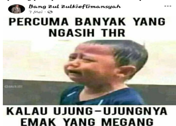
Gambar 10. Lelucon THR

Lelucon (hiburan) adalah wujud ekspresi yang direalisasikan berupa tulisan, pernyataan, atau perbuatan lucu dan menghibur. Dalam konteks ini WPV berupa lelucon (hiburan) adalah berupa pernyataan tertulis, gambar, atau video yang diposting pada platform MSF. Ada 6 (Enam) WPV tentang informasi lelucon (hiburan) yang diposting pada platform MSF, salah satunya berikut ini.