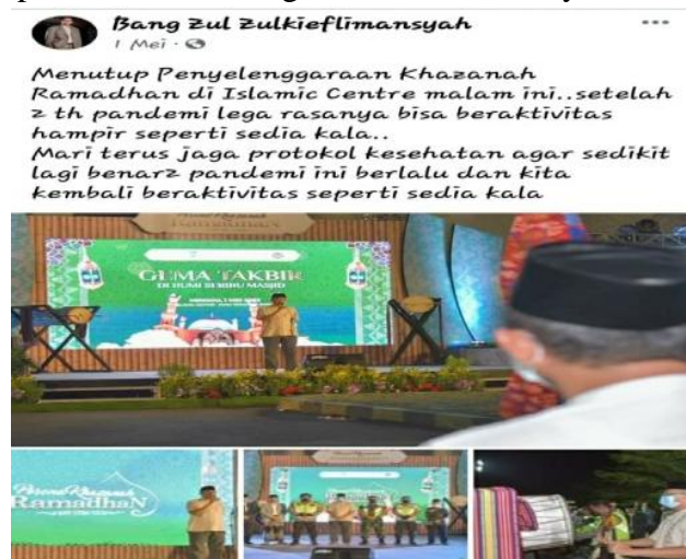
Gambar 2. Himbaun Menjaga Protokol Kesehatan

Wujud ekspresi berupa penyampaian himbaun adalah upaya yang dilakukan oleh penutur atau penulis untuk mempengaruhi partisipan tutur, pendengar, atau pembaca agar melakukan sesuatu sebagaimana yang dihendakinya. Ada 7 (Tujuh) WPV tentang menyampaikan himbaun yang diposting melalui platform MSF. Berikut ini adalah salah satu contoh wujud ekspresi berupa penyampaian himbaun dalam WPV pada platform MSF Bang Zul Zulkieflimansyah.