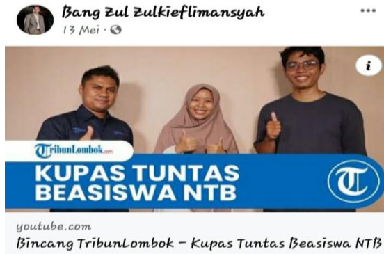
Gambar 12. Informasi Beasiswa

Postingan tersebut mengandung pesan mengajak masyarakat, khususnya generasi muda NTB untuk mengunjungi atau membuka channel youtube tersebut dan mempersiapkan diri untuk ikut kompetisi beasiswa. Dalam postingan tersebut mengandung makna direktif, yaitu berusaha mengajak dan mempengaruhi publik (Nisa, 2021; Sarita & Irawan, 2022).