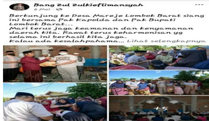
Gambar 8. Kunjungan di Desa Mareje Lombok Barat

Gambar di atas memuat informasi tentang kegiatan Gubernur Nusa Tenggara Barat bersama Kapolda dan Bupati menghadiri undangan Masyarakat Desa Mareje Lombok Barat. Dalam postingan tersebut disertai dengan pesan menjaga keamanan, kenyamanan, dan keharmonisan.