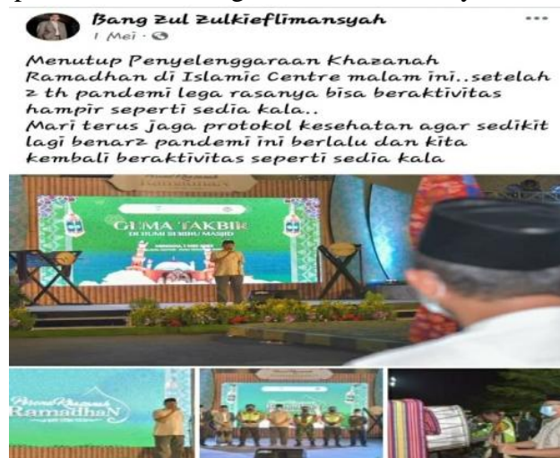
Gambar 2. Himbaun Menjaga Protokol Kesehatan

Wujud ekspresi berupa penyampaian himbaun adalah upaya yang dilakukan oleh penutur atau penulis untuk mempengaruhi partisipan tutur, pendengar, atau pembaca agar melakukan sesuatu sebagaimana yang dihendakinya. Ada 7 (Tujuh) WPV tentang menyampaikan himbaun yang diposting melalui platform MSF. Berikut ini adalah salah satu contoh wujud ekspresi berupa penyampaian himbaun dalam WPV pada platform MSF Bang Zul Zulkieflimansyah.