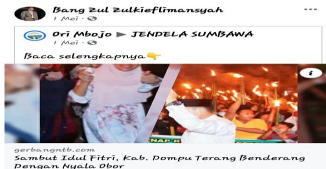
Gambar 1. Budaya Penyambutan Hari Raya Idul Fitri

Wujud ekspresi berupa apresiasi terhadap budaya, seni, dan kuliner merupakan upaya yang dimaksudkan agar berdampak pada apresiasi masyarakat terhadap budaya, seni, dan kuliner. Hal ini sejalan dengan pandangan, bahwa setiap tindakan mengapresiasi sesuatu dapat mempengaruhi apresiasi masyarakat terhadap hal tersebut (Lo, Wu, & Ni 2018; Felski, 2020; Verlie, 2020). Ada 18 (Delapan Belas) WPV yang diposting melalui platform MSF. Salah satu bentuk apresiasi dalam WPV yang diposting oleh pejabat publik pada platform MSF Bang Zul Zulkiflimansyah adalah sebagai berikut.