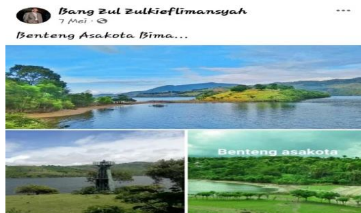
Gambar 9. Objek Wisata Benteng Asakota

Dari gambar postingan di atas kita memperoleh informasi tentang keindahan objek wisata pantai. Gambar objek wisata tersebut diposting beserta teks sebagai keterangan identitas objek wisata tersebut, yaitu “Benteng Asakota” yang berada di Bima. Dengan demikian, informasi tersebut mengandung promosi sekaligus ajakan untuk berkunjung ke sana.