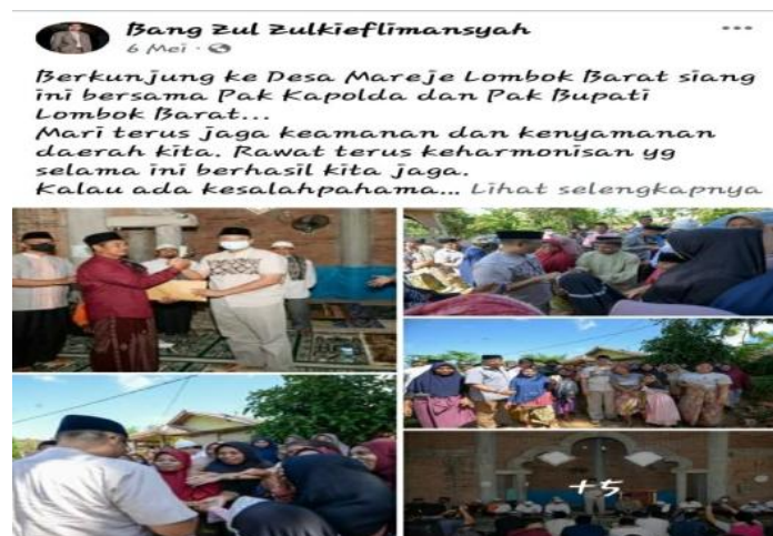
Gambar 8. Kunjungan di Desa Mareje Lombok Barat

Informasi menghadiri kegiatan merupakan wujud ekspresi partisipasi dalam kegiatan masyarakat atau kelompok masyarakat. Dalam konteks ini adalah berupa WPV berupa informasi menghadiri kegiatan yang diposting pada platform MSF. Ada 41 (Empat Puluh Satu) WPV tentang informasi menghadiri kegiatan yang diposting melalu platform MSF yang merupaka informasi menghadiri kegiatan, salah satunya berikut ini.