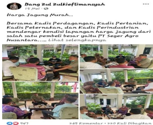
Gambar 13. Pembahasan Harga Jagung

Respons masalah petani dan peternak adalah realitas ekspresi yang diwujudkan dalam bentuk tulisan, pernyataan, maupun perbuatan. Dalam konteks ini WPV diekspresikan dalam bentuk postingan tulisan, gambar, atau video. Ada 5 WPF tentang respons masalah petani dan peternak yang diposting pada platform MSF Bang Zul Zulkieflimansyah. Hanya 1 (Satu) peristiwa hukum yang diposting yaitu sebagai berikut.