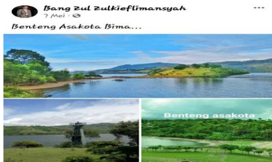
Gambar 9. Objek Wisata Benteng Asakota

Dari gambar postingan di atas kita memperoleh informasi tentang keindahan objek wisata pantai. Gambar objek wisata tersebut diposting beserta teks sebagai keterangan identitas objek wisata tersebut, yaitu "Benteng Asakota" yang berada di Bima. Dengan demikian, informasi tersebut mengandung promosi sekaligus ajakan untuk berkunjung ke sana.