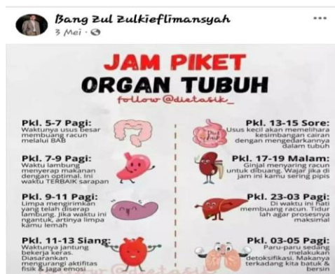
Gambar 6. Informasi Kesehatan

Informasi kesehatan yang dimaksud adalah bentuk ekspresi yang memuat perihal tentang kesehatan yang disampaikan secara lisan atau tertulis. Dalam konteks ini ekspresi informasi kesehatan adalah berupa tulisan, gambar, atau video dalam WPV pada platform MSF. Ada 2 (Dua) WPV tentang informasi kesehatan yang diposting melalui platform MSF, salah satunya berikut ini.