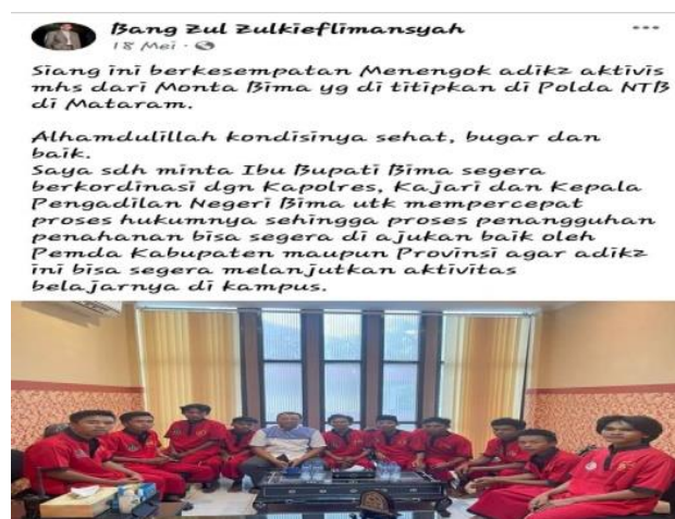
Gambar 14. Peristiwa Hukum

Pada gambar di atas terlihat Gubernur Nusa Tenggara Barat sedang duduk di tengah-tengah pemuda berpakaian seragam tahana warna merah. Dalam teks yang menyertai foto di atas terdapat keterangan yang menjelaskan bahwa Gubernur NTB sedang menjumpai (menengok) mahasiswa yang ditahan di Polda NTB. Para mahasiswa yang dijumpai itu adalah para demonstran. Bahkan, dalam gambar di atas dapat diperoleh informasi bahawa motif kedatangan Gubernur NTB untuk memastikan mahasiswa dalam kondisi sehat, dan mengupayaan penyelesaian masalah hukum.