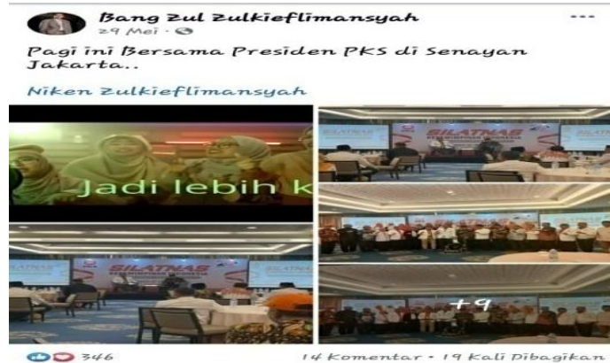
Gambar 15. Silatnas PKS di Senayan Jakarta