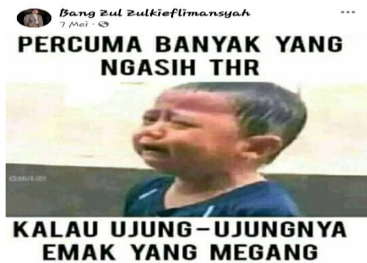
Gambar 10. Lelucon THR

Gambar dan teks yang ada pada postingan tersebut di atas mengandung unsur lucu dan menghibur. Postingan tersebut hanyalah berupa satire yang menggambarkan fenomena pada momentum hari raya, yaitu bahwa ada suasana kebahagiaan dan fenomena lucu yang menyertai.