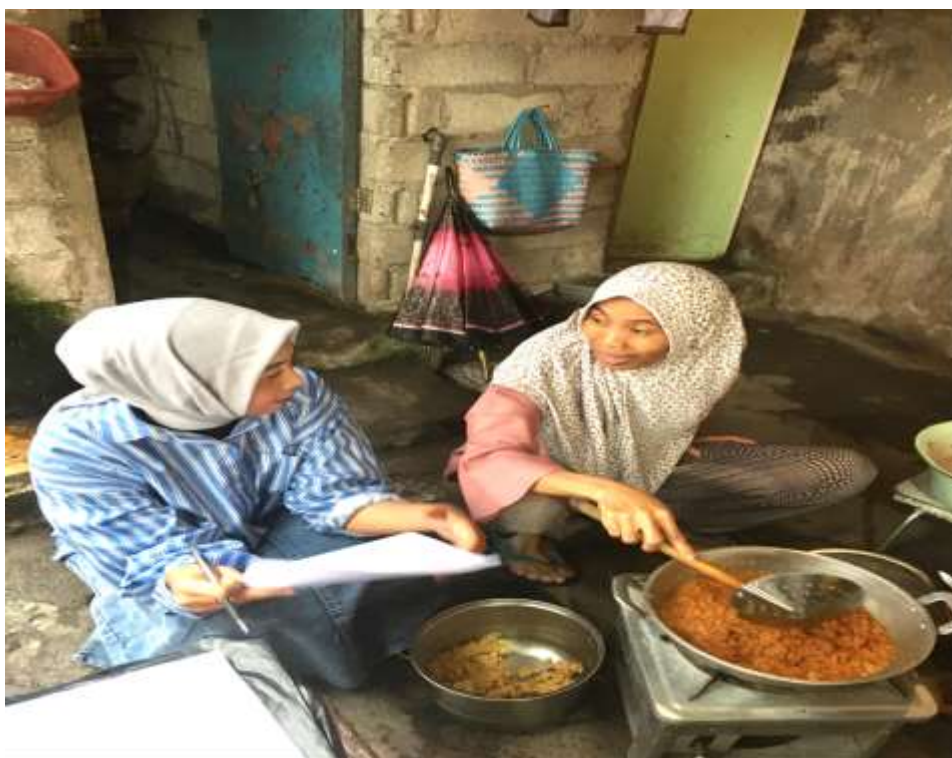
Sumber Gambar : Dokumentasi Peneliti Desember 2023