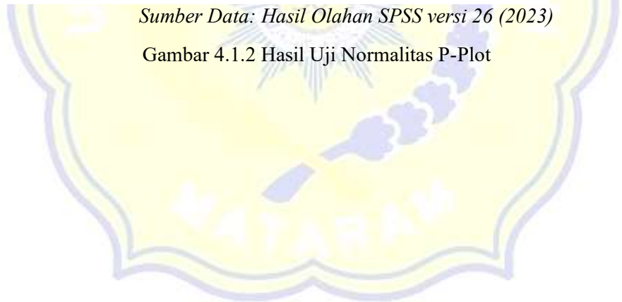
Gambar 4.1.2 Hasil Uji Normalitas P-Plot