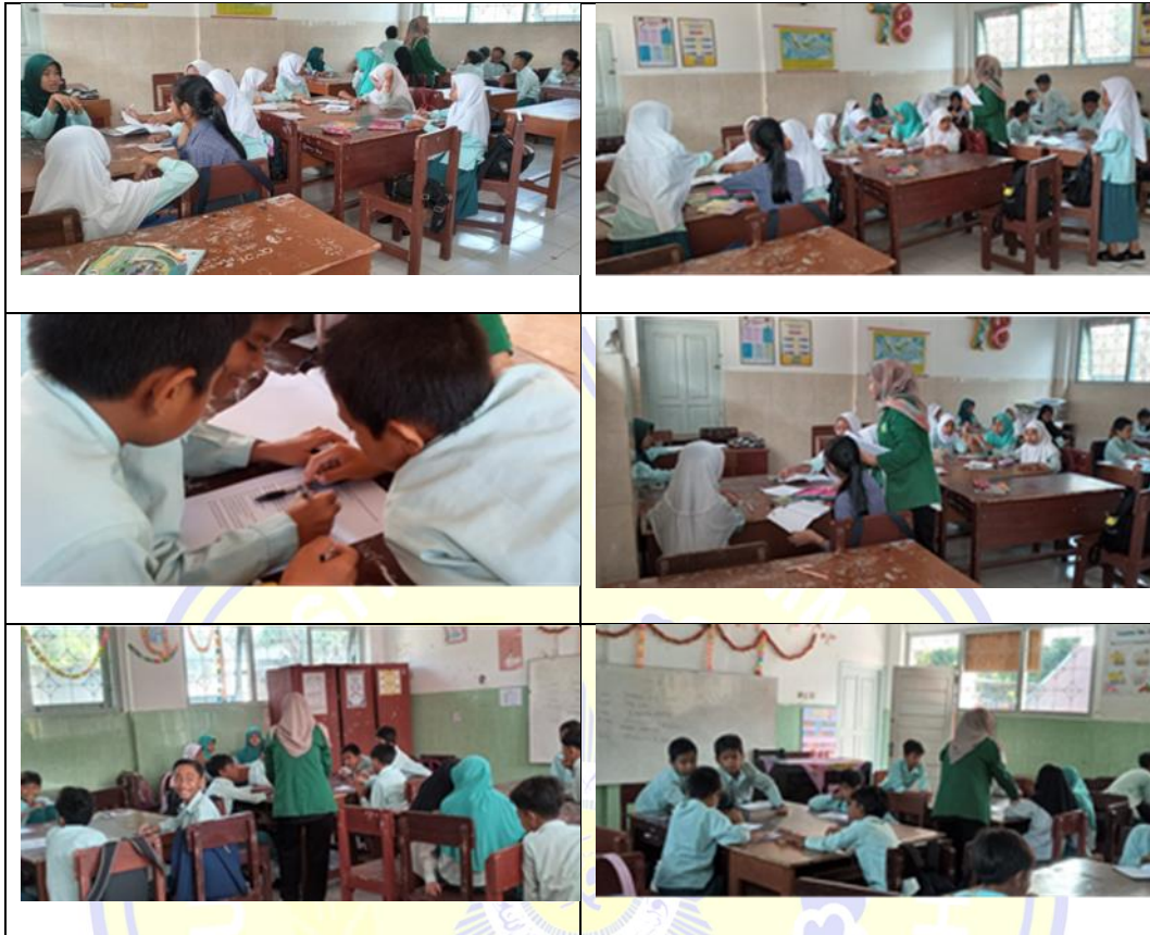
Lampiran 13. Siswa Kelas Eksprimen dan Kelas Kontrol