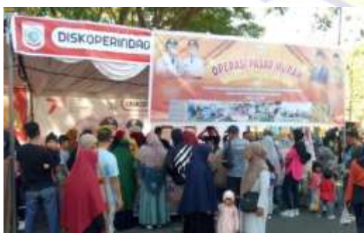
Sumber : Dinas Koperindag (2023)