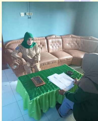
Peneliti dan Staf Desa Penyaring