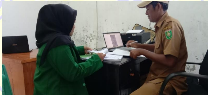
Peneliti dan sekretaris desa