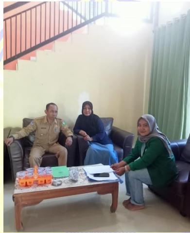
Peneliti dan Kades Desa Penyaring