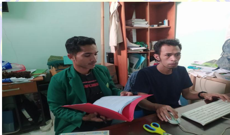
Wawancara Bersama Staf DPW PBB NTB