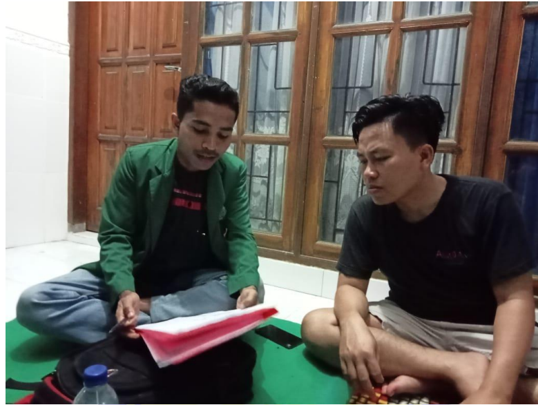
Wawancara Bersama Sekretaris Pemuda DPW PBB