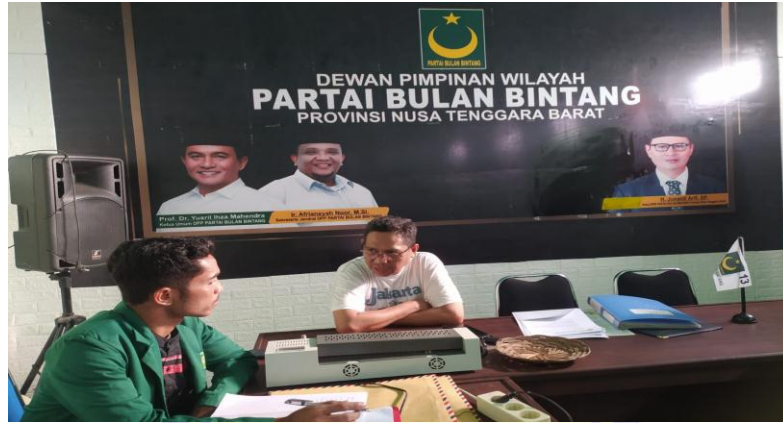
Wawancara Bersama Bendahara DPW PBB NTB