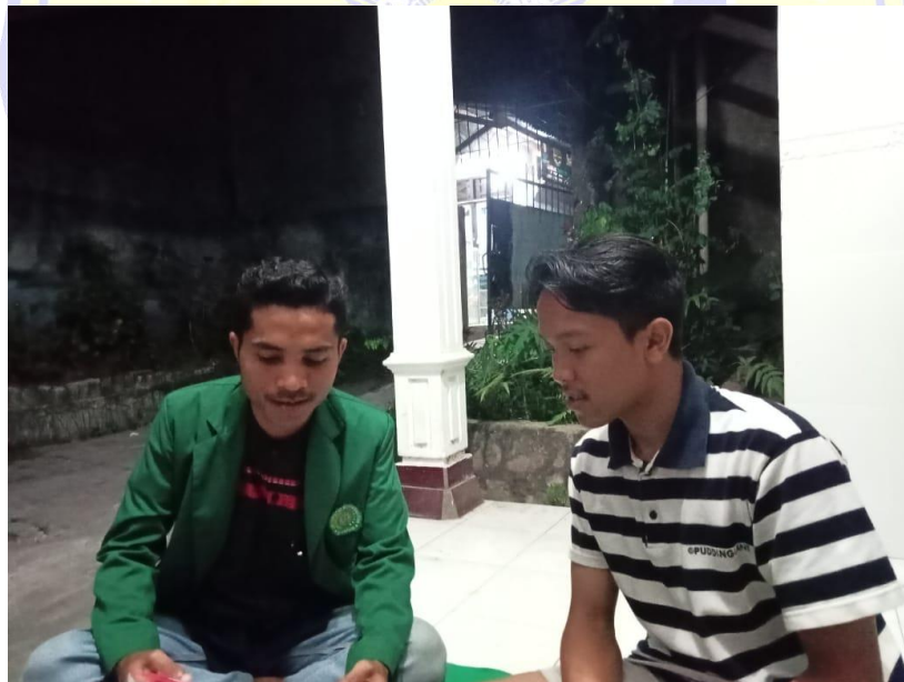
Wawancara Bersama Masyarakat Dapil 6