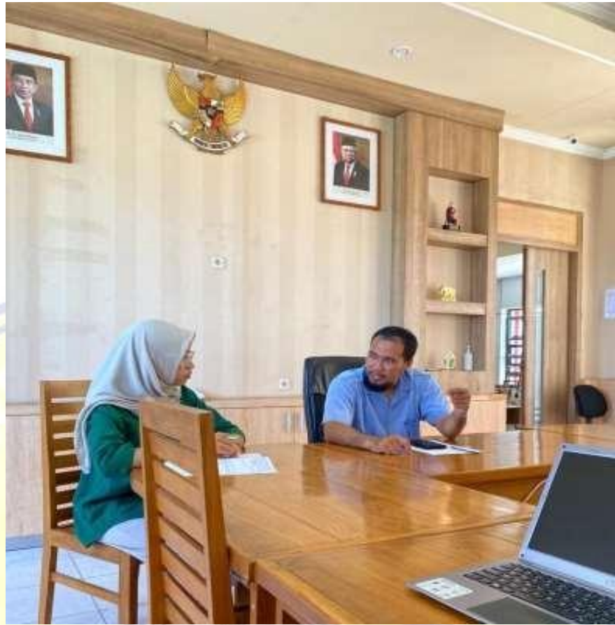
Dokumentasi Wawancara dengan Kepala Bidang Pemasaran Dinas Pariwisata Kabupaten Lombok Timur