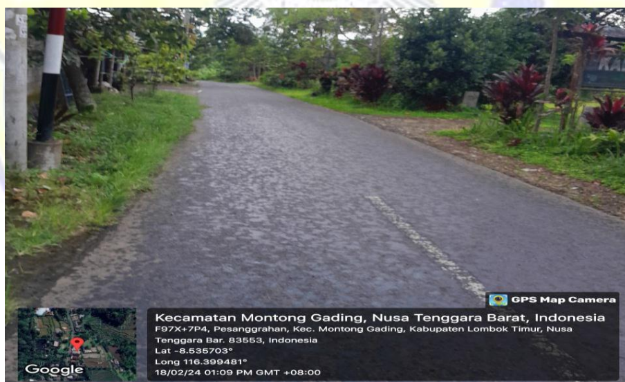
Akses jalan menuju Destinasi Wisata Otak Kokoq Joben