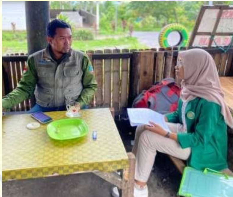
Dokumentasi Wawancara dengan Kepala Resort Otak Kokoq Joben dari pihak BTNGR (Balai Taman Nasional Gunung Rinjani)