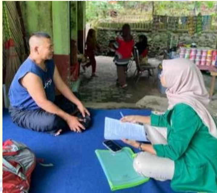
Dokumentasi Wawancara dengan pedagang yang ada di Destinasi Wisata Otak Kokoq Joben di Desa Pesangrahan, Kecamatan Montong Gading, kabupaten