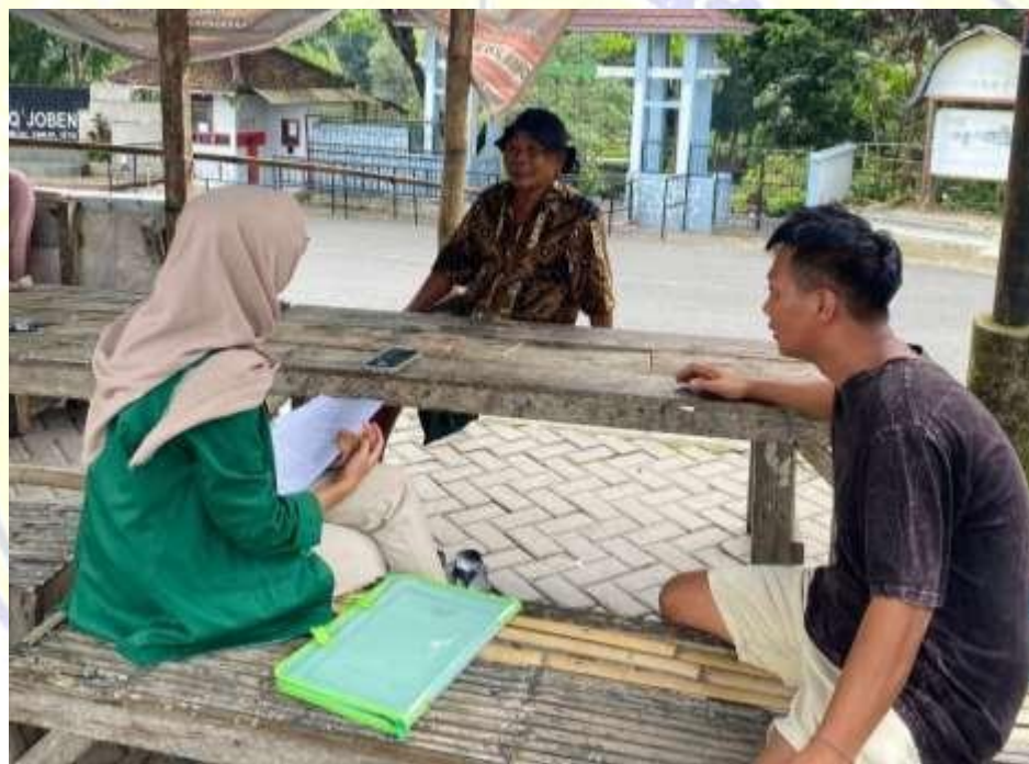
Dokumentasi Wawancara dengan masyarakat sekitar Destinasi Wisata Otak Kokoq Joben di Desa Pesanggrahan, Kecamatan Montong Gading, kabupaten Lombok Timur