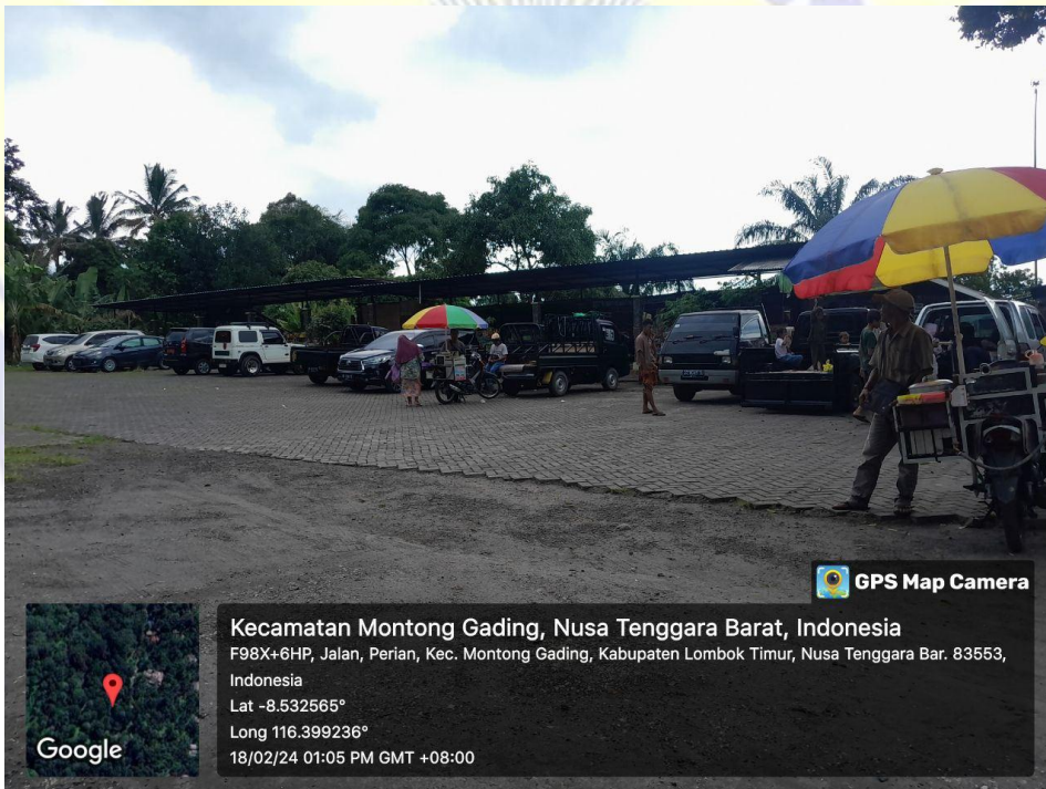
Area parkir Destinasi Wisataa Otak Kokoq Joben