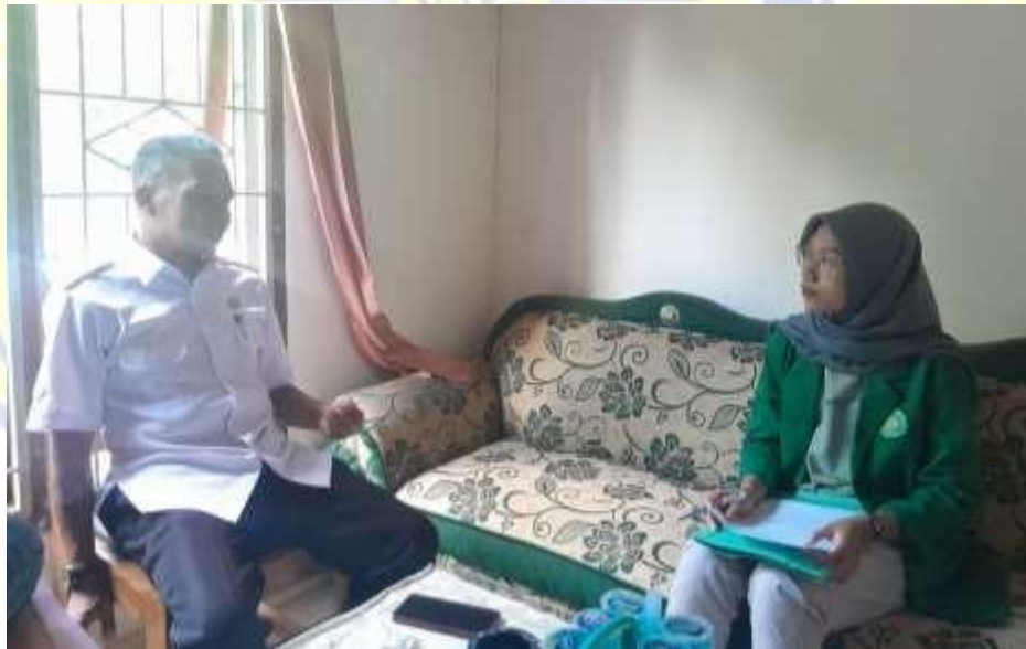
Dokumentasi Wawancara dengan Pemerintah Desa Pesanggrahan, Kecamatan