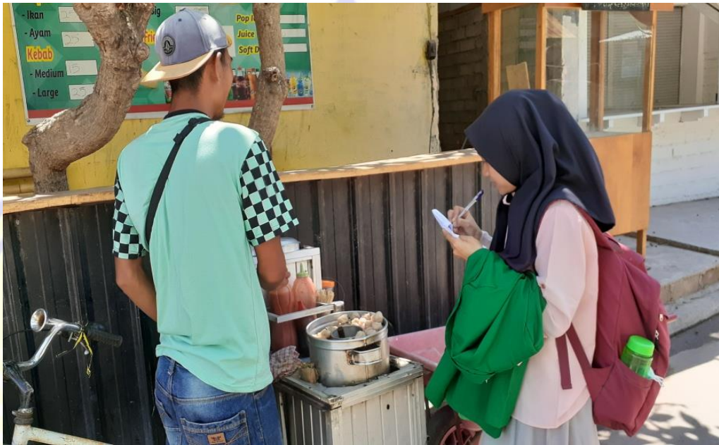
Gambar 4.8 Wawancara dengan wisatawan di Gili Indah