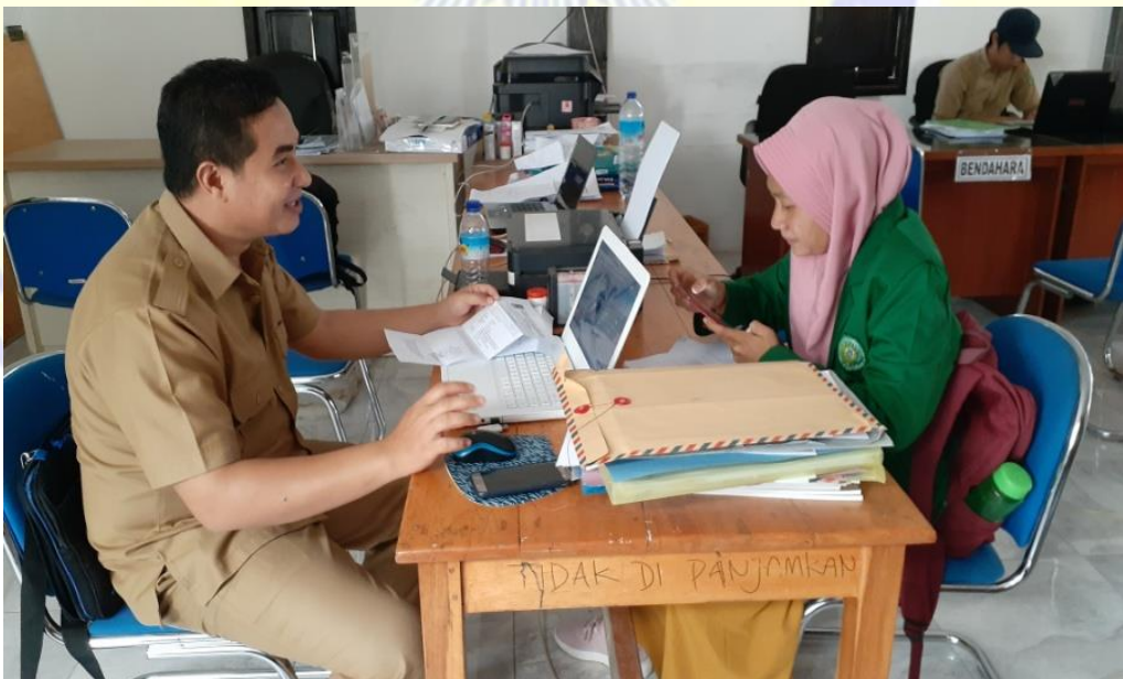
Wawancara dengan Kasi Pemerintahan Desa Gili Indah