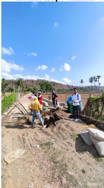
Pembangunan jalan yang menuju ke sawah warga di Desa Rai Oi Kecamatan Sape Kab. Bima