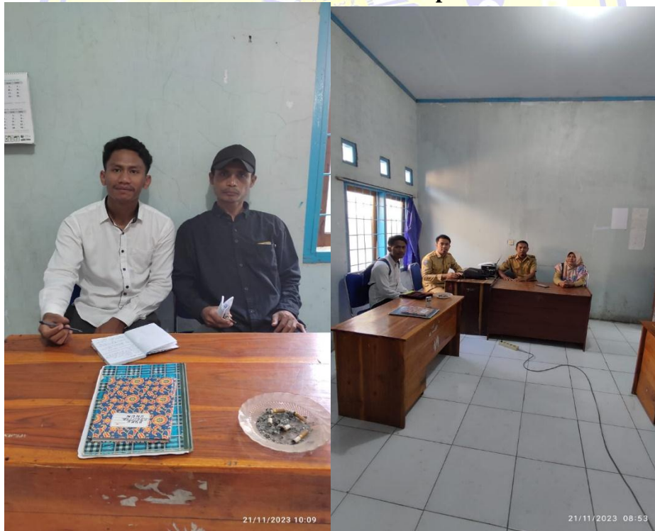
Foto Dengan Aparat Desa Rai Oi Kecamatan Sape Kab. Bima