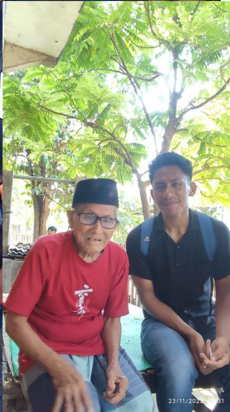
Masyarakat yang menerima BLT