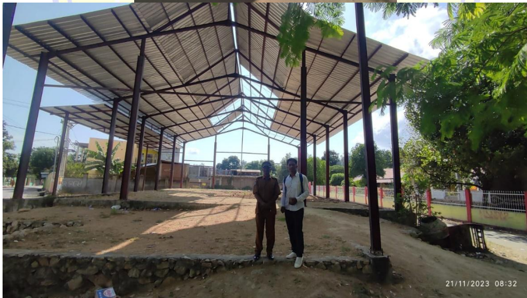
Pembangunan Gedung Serba Guna di Desa Rai Oi Kecamatan Sape Kab. Bima