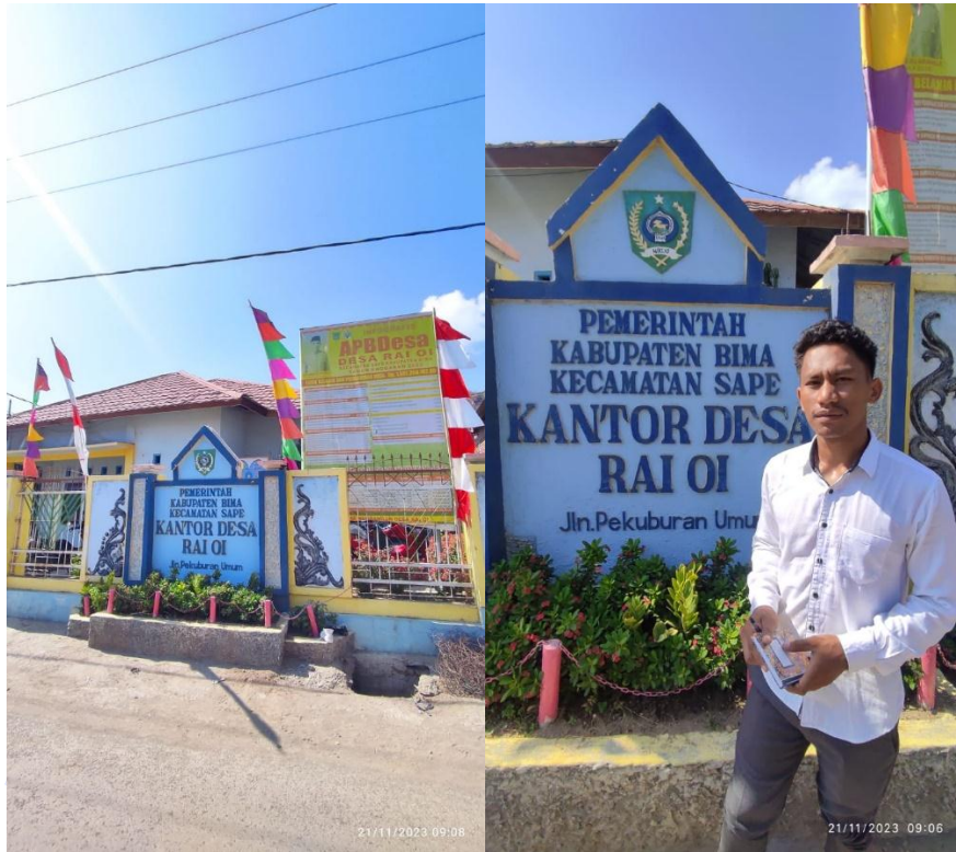
Kantor Desa Rai Oi Kecamatan Sape Kab. Bima