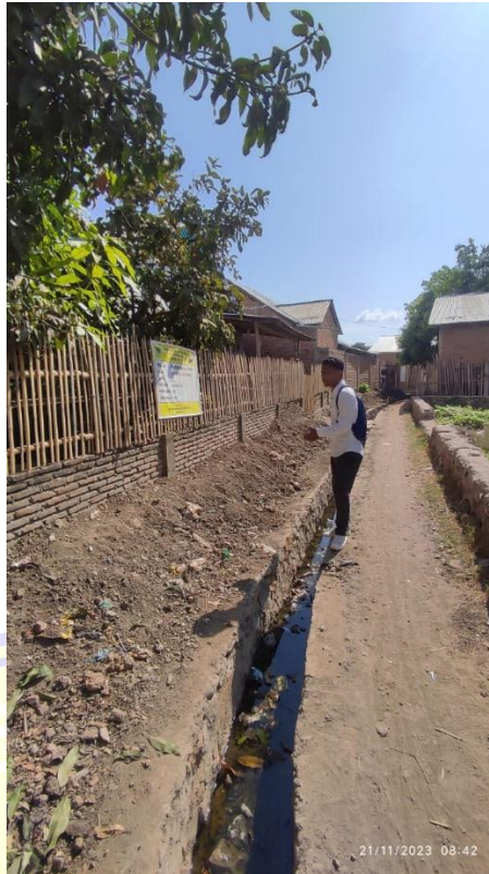
Rehabilitasi Pembangunan Drainase di Desa Rai Oi Kecamatan Sape Kab. Bima