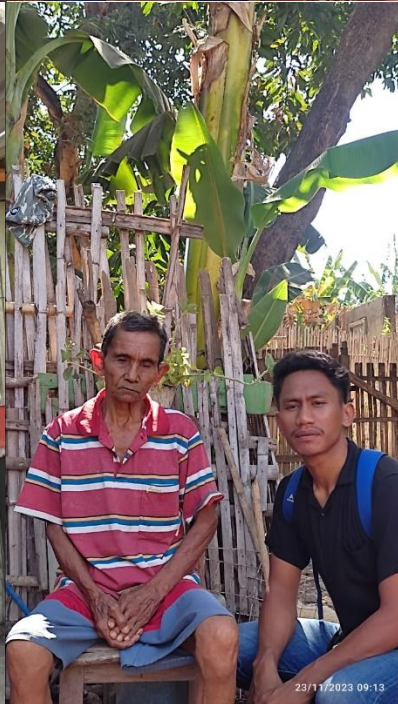
Masyarakat yang menerima BLT