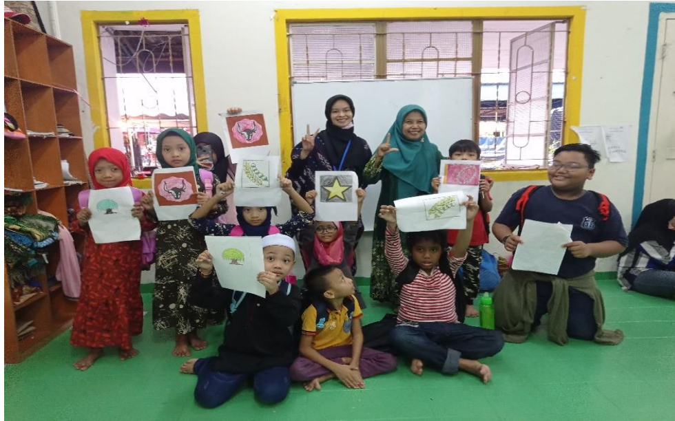
Gambar 1. Kegiatan memahami lambang-lambang pancasila