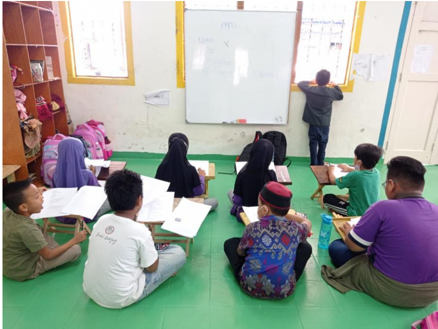
Gambar 3. Kegiatan Kegiatan evaluasi