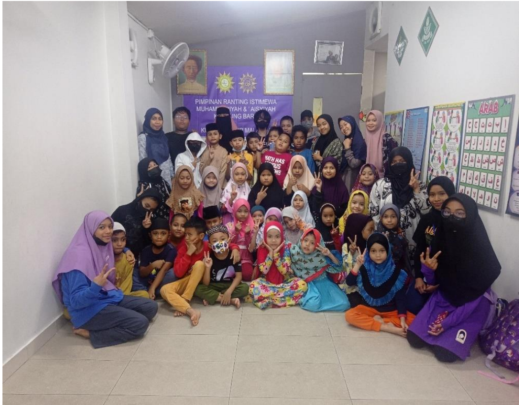
Gambar 5. Kegiatan pengautan literasi kebangsaan untuk integrasi bangsa