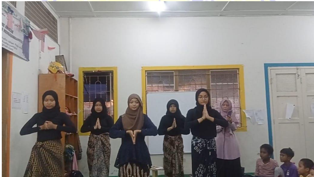
Gambar 4. Kegiatan pelatihan penarian indonesia