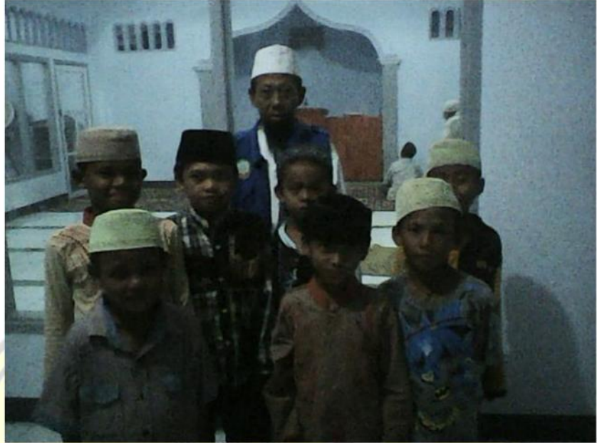
الداعي مع الأطفال بعد تعليمهم قراءة القرآن