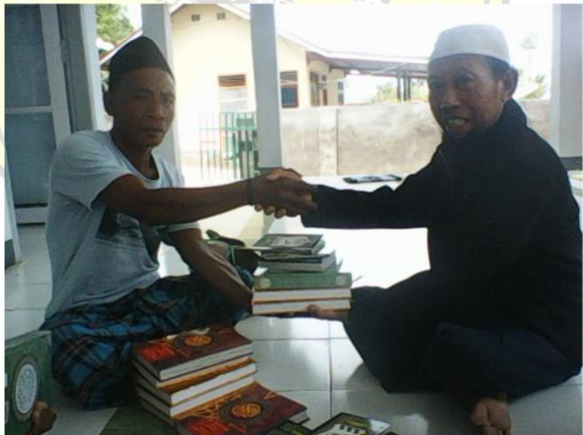
يدفع المصنف الأستاذ والأطفال تعلمهم قراءة القرآن في المسجد تلقى شكراً بآمين