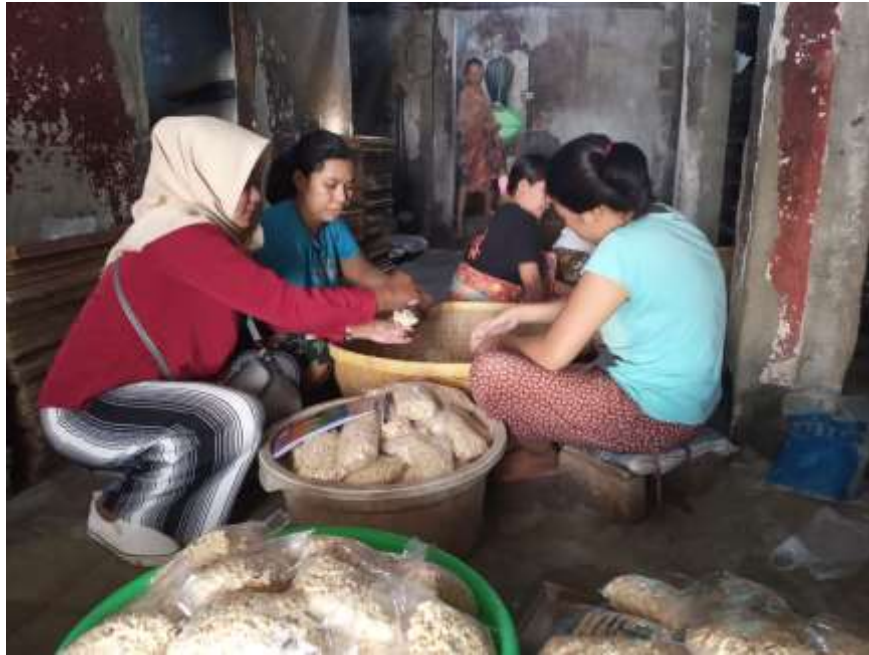
Proses Pengemasan Tempe