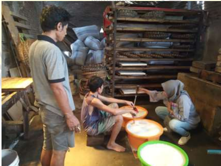
Proses Pembuatan Adonan Tahu