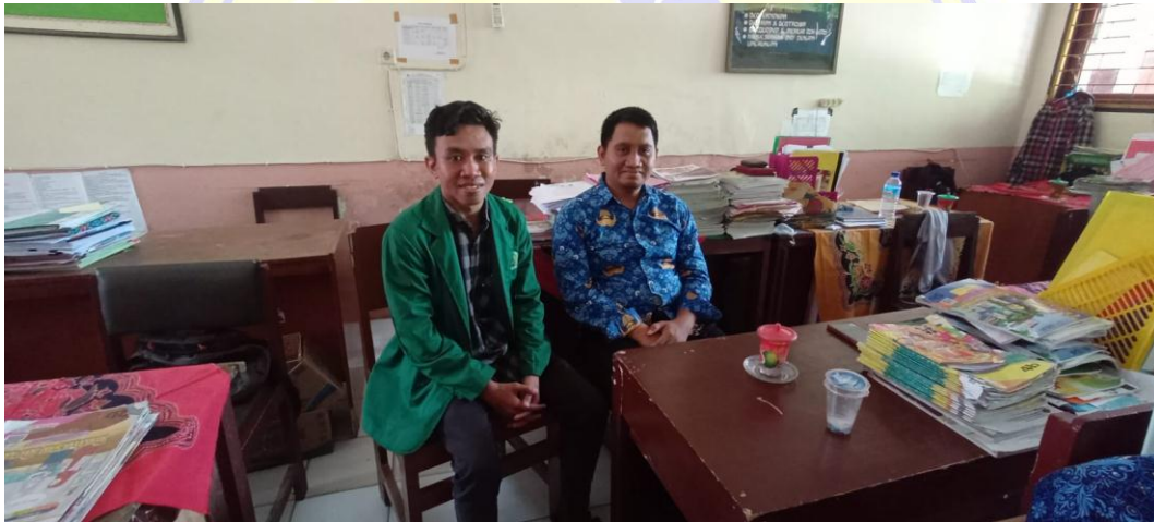
Foto 3 wawancara dengan guru Al-Qur'an hadist MIN 2 lombok Barat