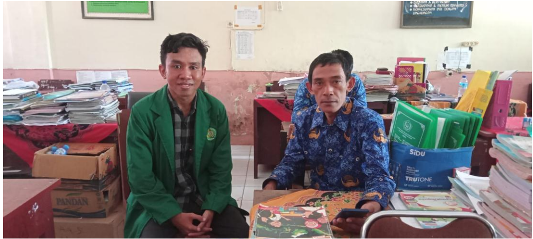
Foto 2 Wawancara dengan wali kelas IV B MIN 2 Lombok Barat