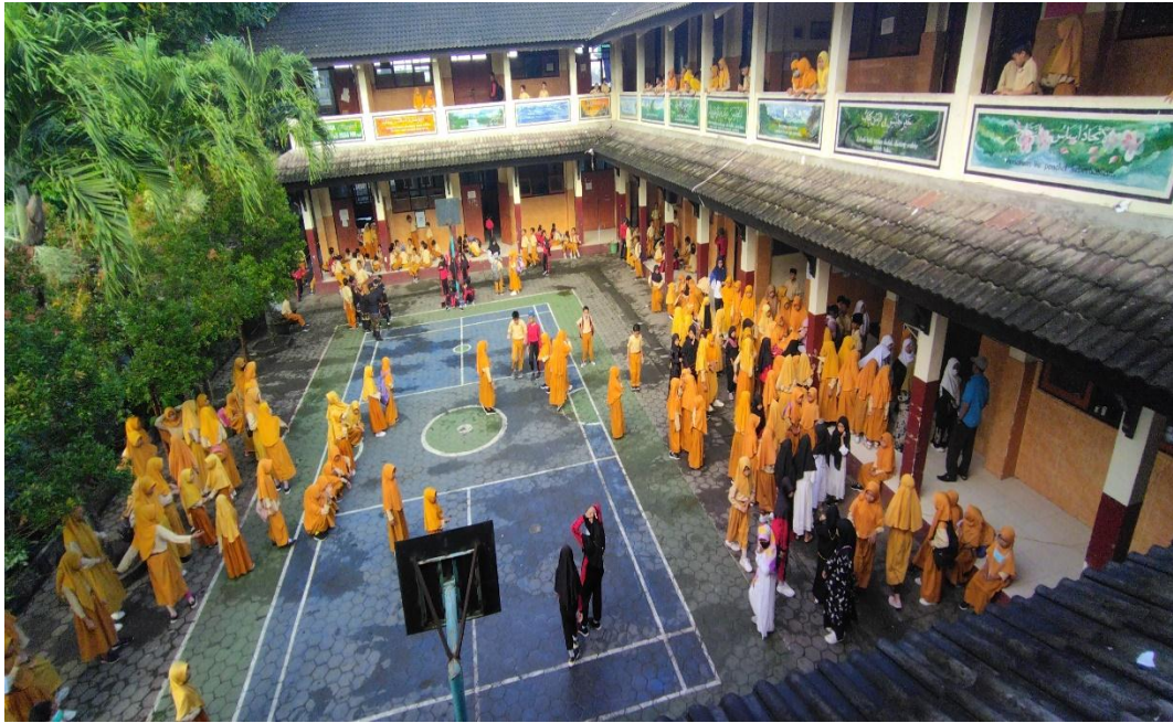
Foto 1 MIN 2 Lombok Barat