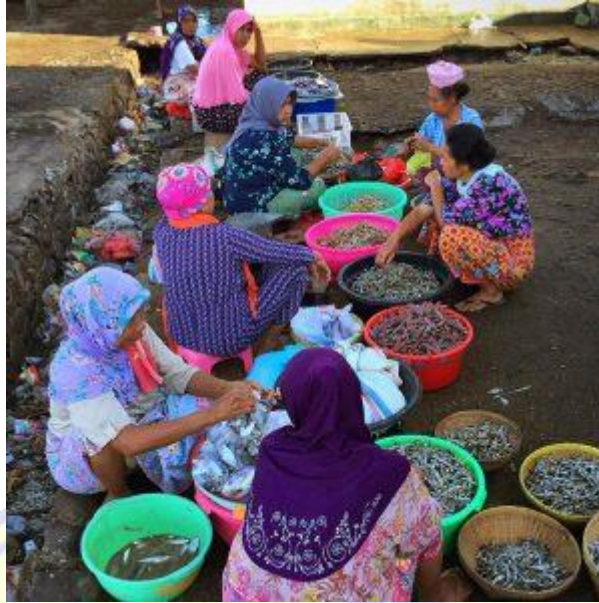
Gambar. Pedagang/penjual ikan di Pasar Tanjung Luar