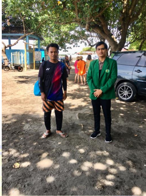
Gambar. Penyerahan surat penelitian di Kantor Desa Tanjung Luar