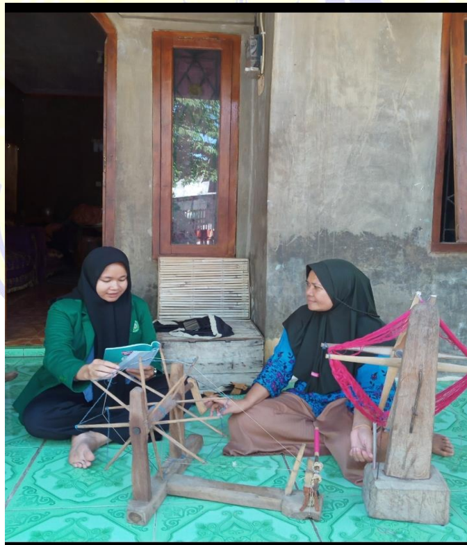
Gambar 7. Foto Alat Tenun Silungkang (ATBM)