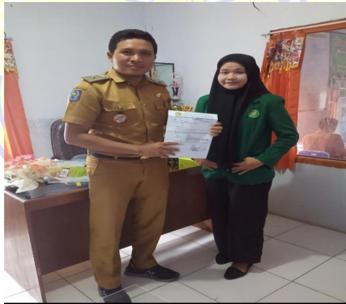
Gambar 2. Memberikan Surat Penelitian Kepada Bapak Kepala Desa Monta Baru