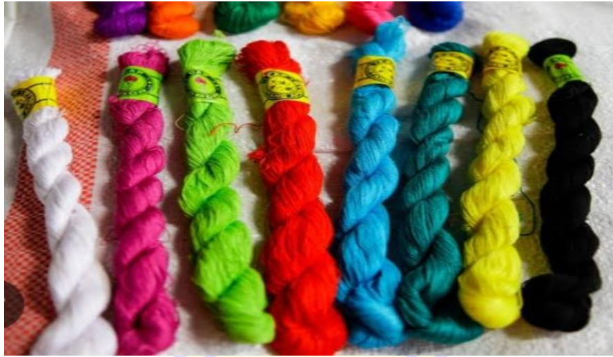
Gambar 8. Foto Benang Pakan/Palet(Kecil)