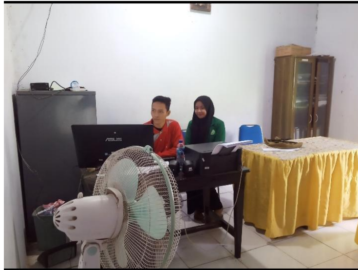
Gambar 3. Wawancara dengan Bapak Operator Desa Monta Baru