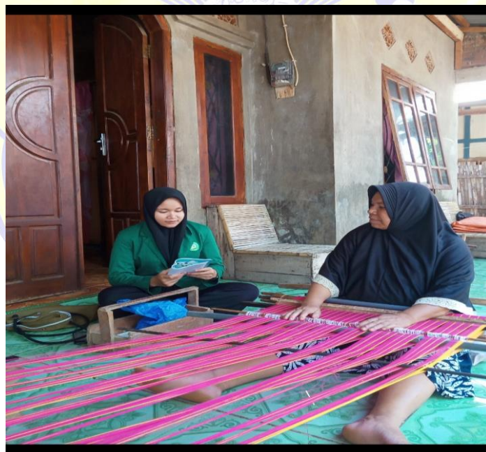
Gambar 6. Foto Bersama Masyarakat Pengrajin Tenun Silungkang