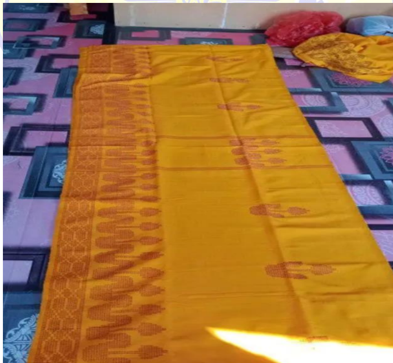
Gambar 11. Foto Tenun Silungkang Bermotif Bunga Kecil