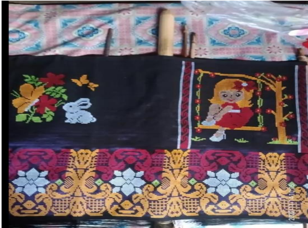
Gambar 12. Foto Tenun Silungkang Bermotif Kartun