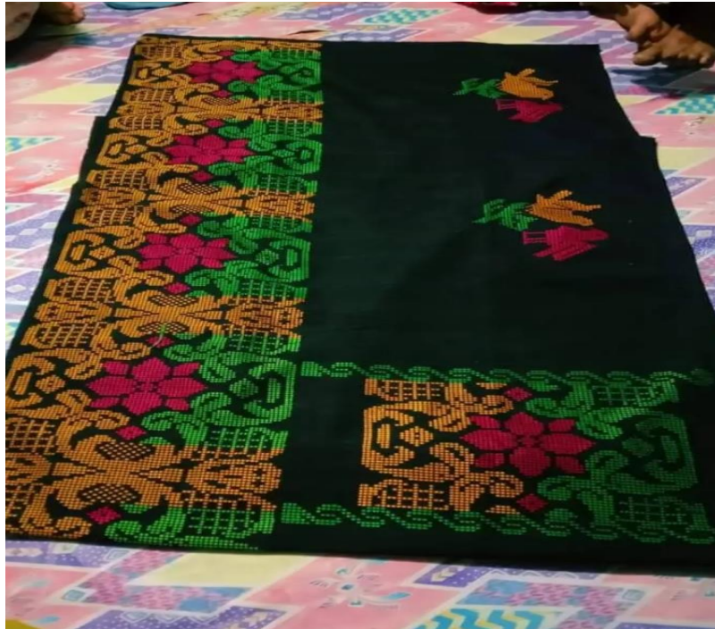
Gambar 10. Foto Tenun Silungkang Bermotif