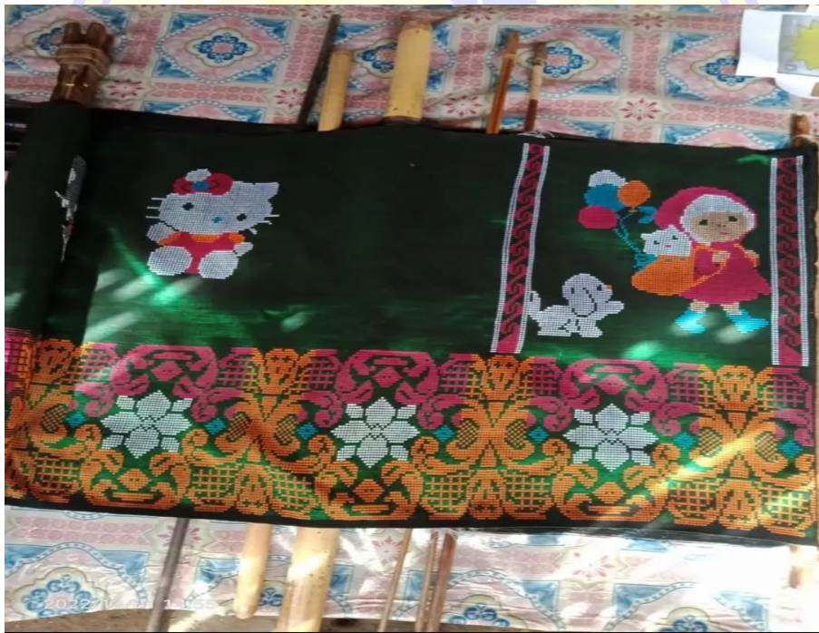
Gambar 9. Foto Tenun Silungkang Bermotif Kartun