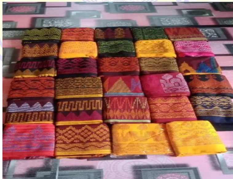
Gambar 5. Foto Pemilik Usaha Tenun Silungkang