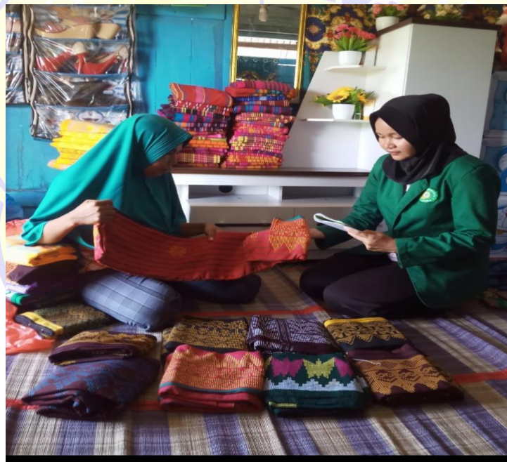
Gambar 4. Wawancara Peneliti Dengan Pemilik Usaha Tenun Silungkang