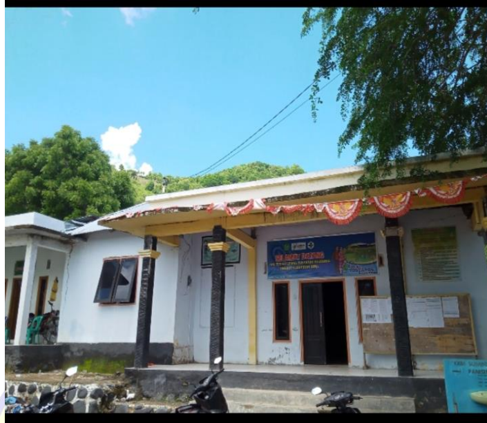
Gambar 1. Kantor Desa Monta Baru, Kec. Lambu Kabupaten Bima