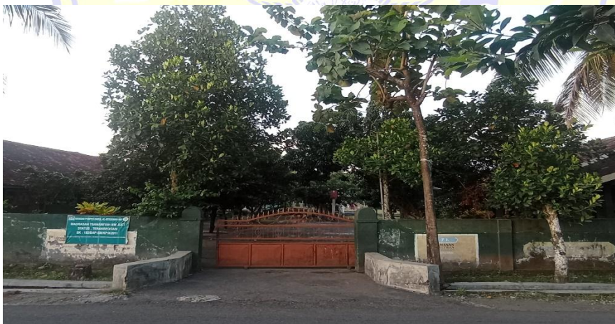
Keterangan : Bangunan MTs Nw Juet Desa Lepak Timur