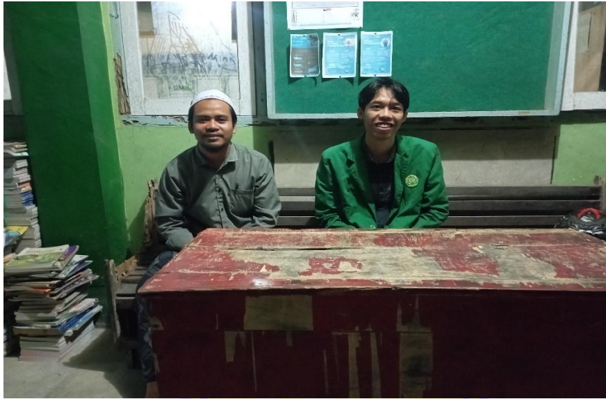
Keterangan : Wawancara dengan guru bahasa Arab Kelas 7 MTs Nw Juet Desa Lepak Timur