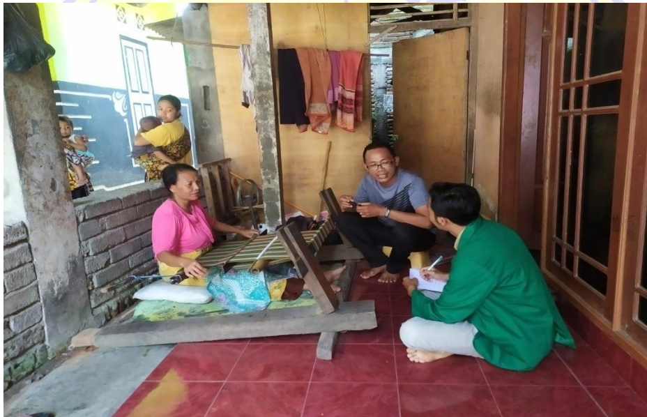
Keterangan : Wawancara pengrajin tenun gedongan