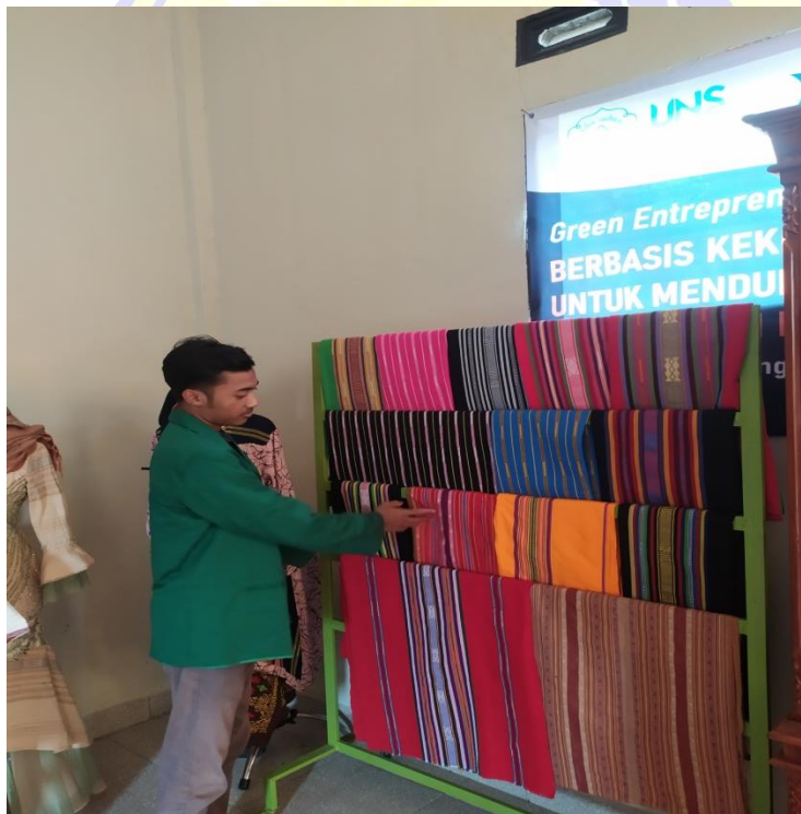
Keterangan : kain tenun gedongan