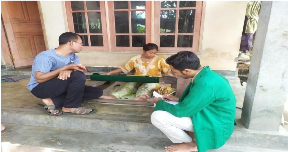
Keterangan : Wawancara pengrajin tenun gedongan