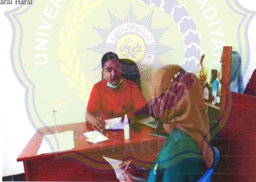
Wawancara dengan Kepala Puskesmas Benteng Desa Golo Pongkor