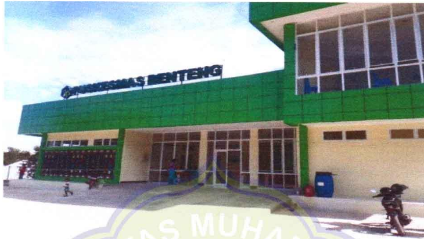
Gambar Puskesmas Benteng Desa Golo Pongkor Kec. Komodo Kab. Manggarai Barat