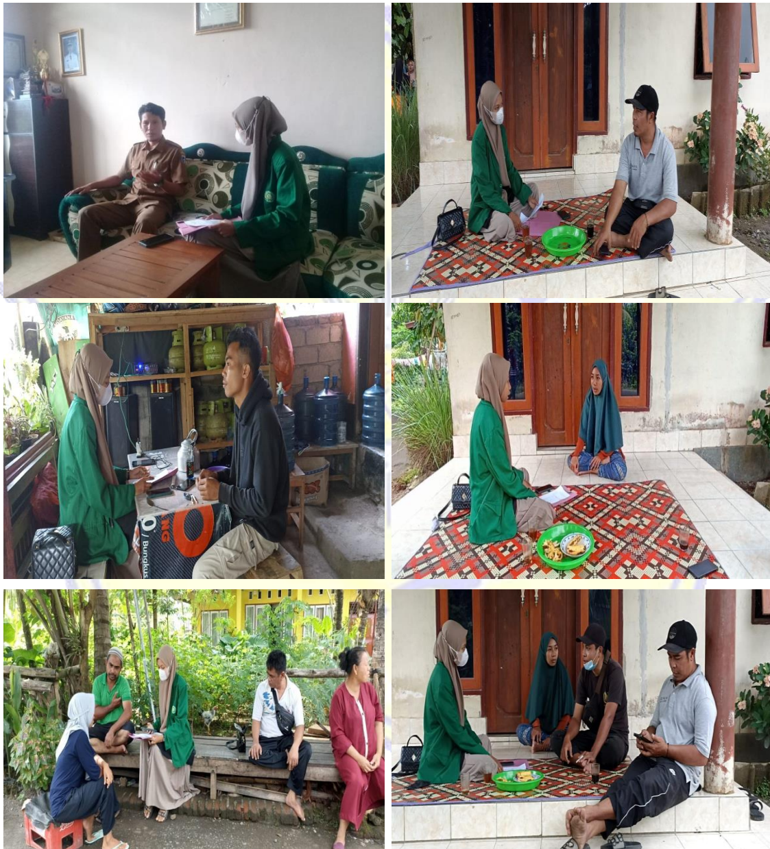
Gambar 1 : Foto Wawancara Dengan Informan