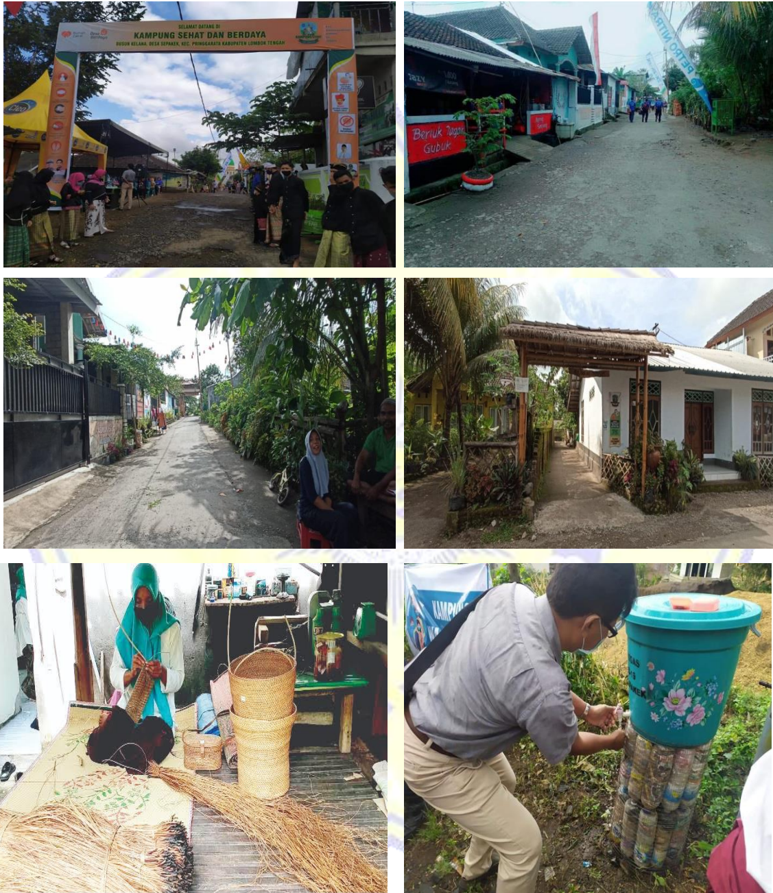
Gambar 2 : Lokasi Wisata Kampung Sehat