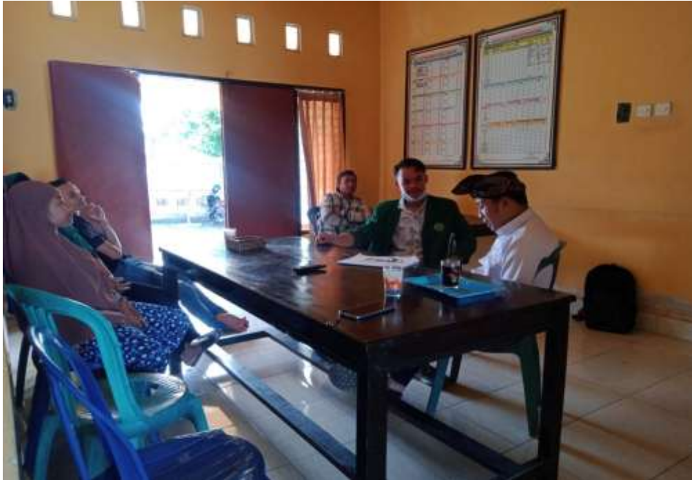
Pengambilan data secara lansung di kepala desa suwangi timur