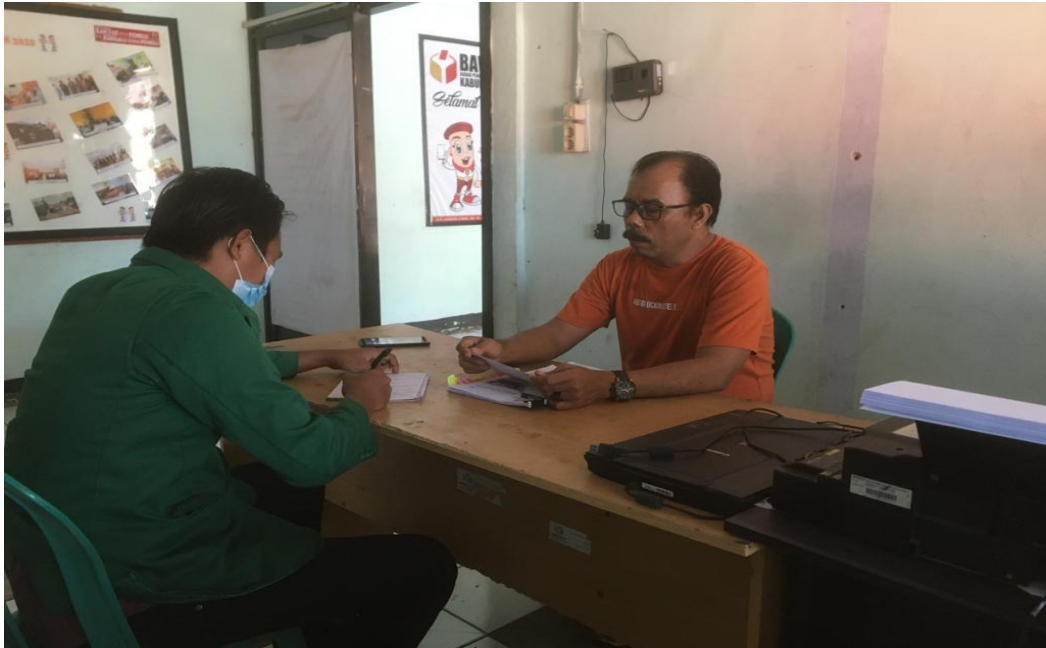
Wawancara dengan Ketua Bawaslu Kabupaten Dompu