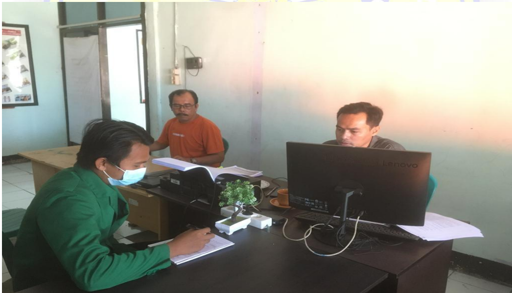
Wawancara dengan sekretariat Bawaslu Kabupaten Dompu