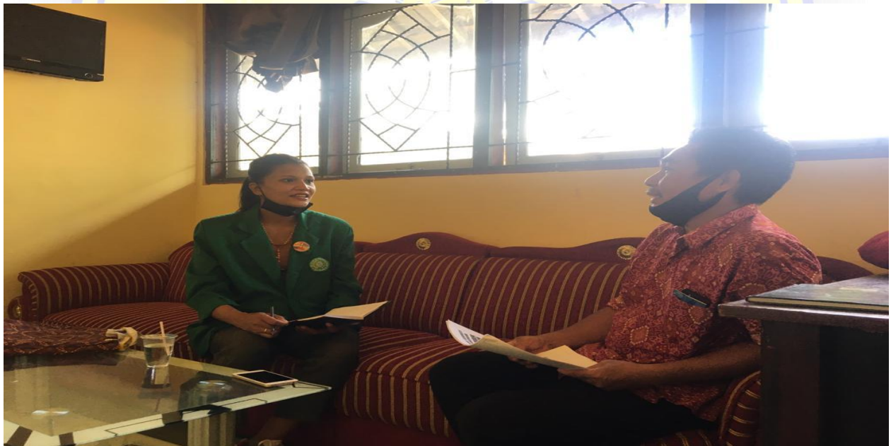
Wawancara penelitian dengan bagian kordinator pendataan SDGs desa karang bayan