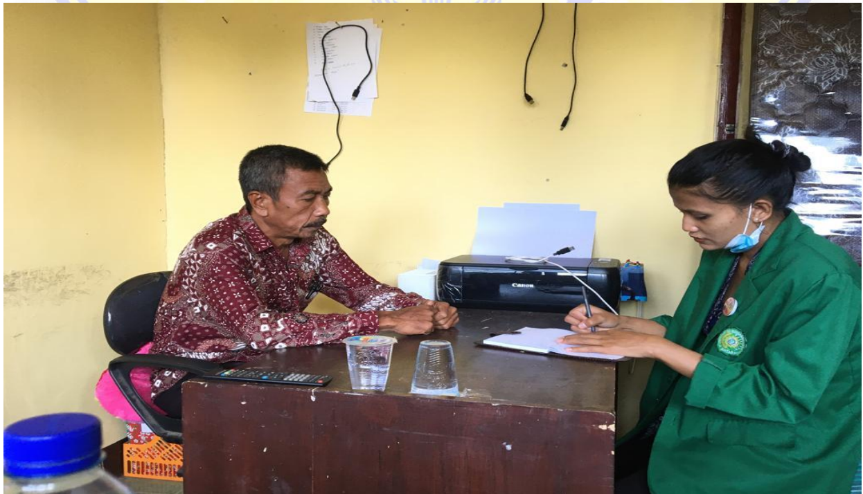
Wawancara penelitian dengan kasi kesejahteraan rakyat desa karang bayan