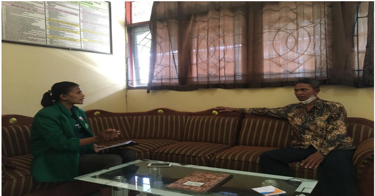
Wawancara penelitian dengan kepala desa karang bayan