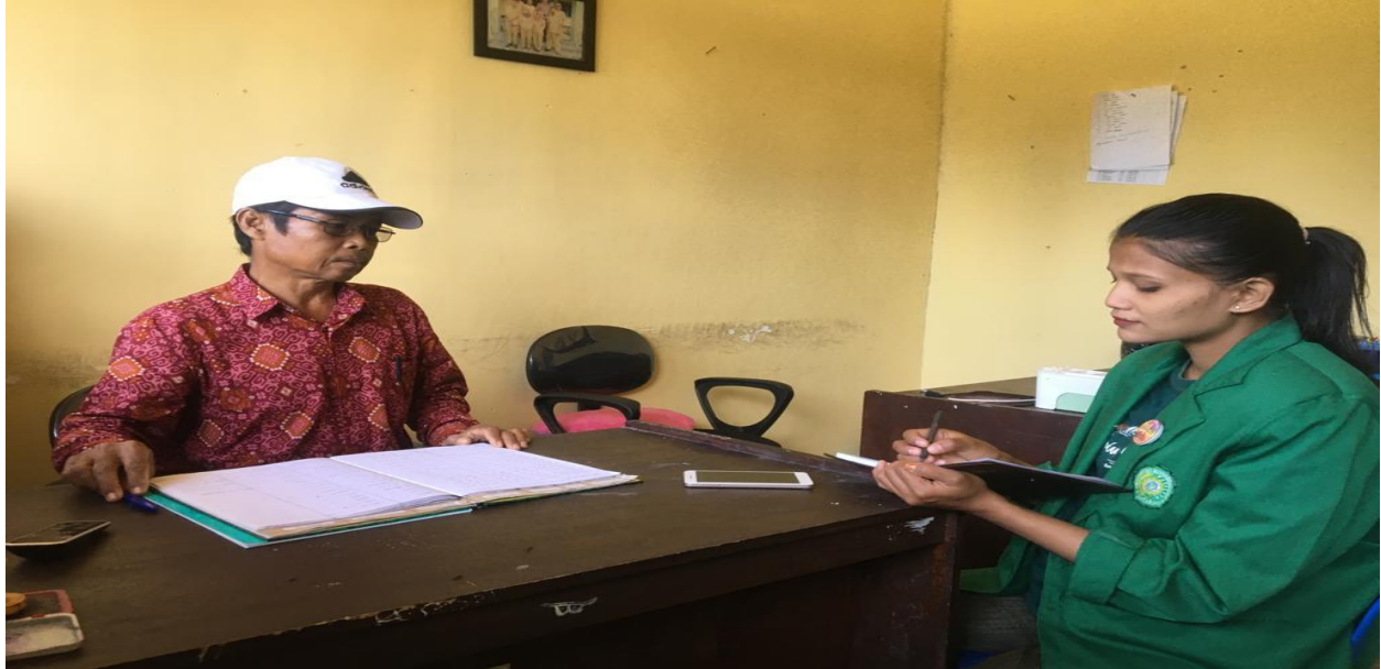
Wawancara penelitian dengan pokja relawan pendataan SDGs desa karang bayan