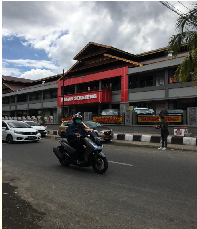
Gambar 4.3 Surveyor Jalan yusudarso arah pasar