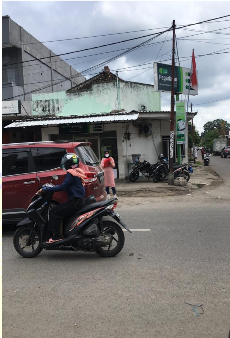
Gambar 4.4 Jalan Yos Sudarso arah pasar seketeng sumbawa besar