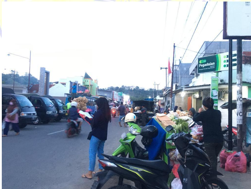
Gambar 4.2 Jalan Yos Sudarso arah pasar seketeng sumbawa besar