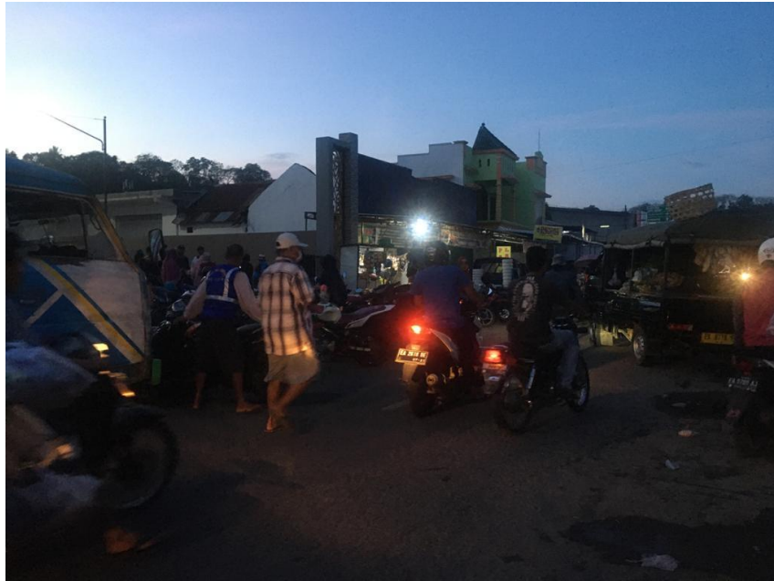
Gambar 4.1 Jalan Yos Sudarso arah pasar seketeng sumbawa besar