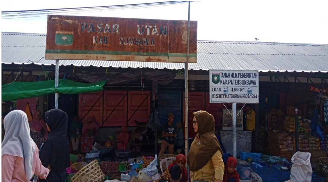
Suasana Pasar Tradisional Kec. Utan Kab. Sumbawa