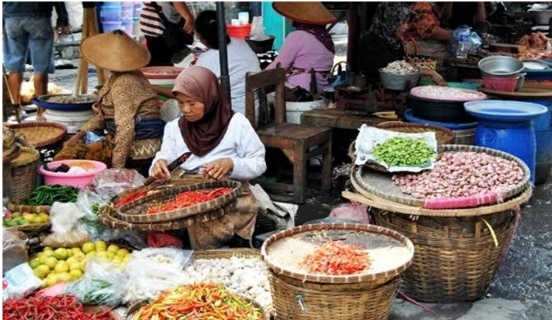
Suasana pedagang pasar tradisional Kec. Utan Kab. Sumbawa