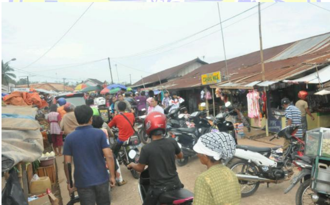
Kondisi pasar tradisional Kec. Utan Kab. Sumbawa