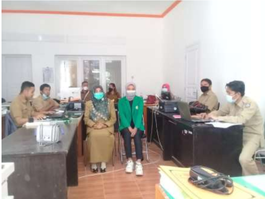
Foto Bersama Pegawai Dinas Perindustrian Kota Mataram