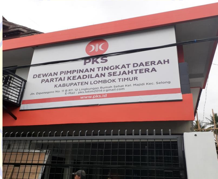
(Tampak depan kantor sekretariat DPD PKS Kab. Lombok Timur)