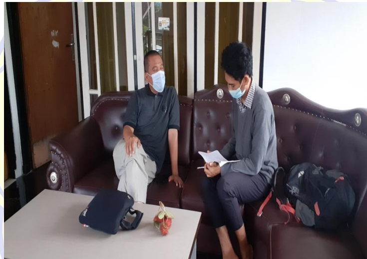
( Wawancara dengan bidang Kaderisasi)