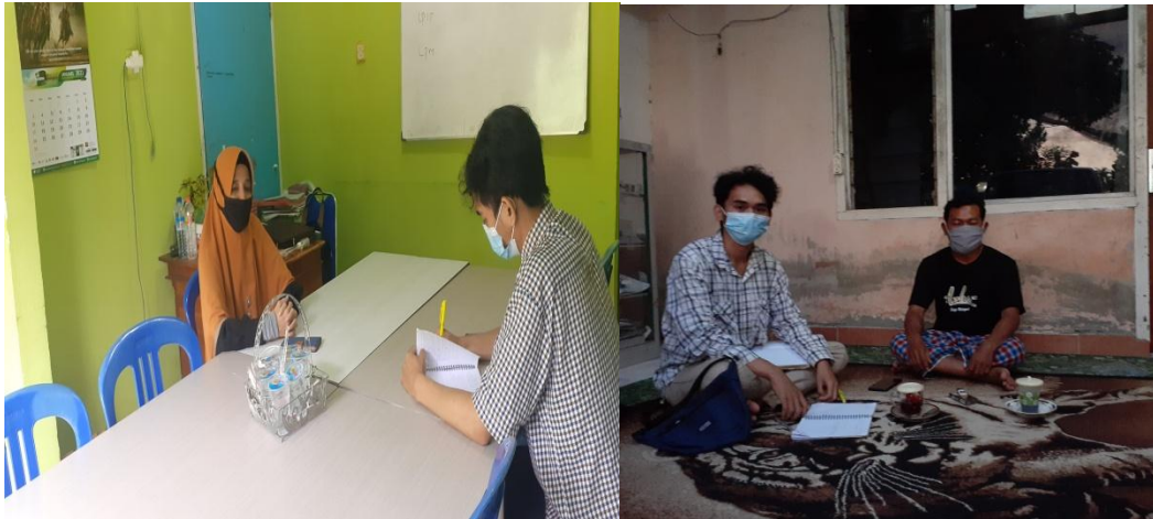
( Wawancara dengan calon legislatif PKS Pada pemilu legislatif 2019)