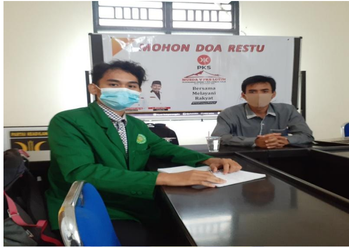
( Wawancara dengan sekretaris DPD PKS Kab. Lotim)