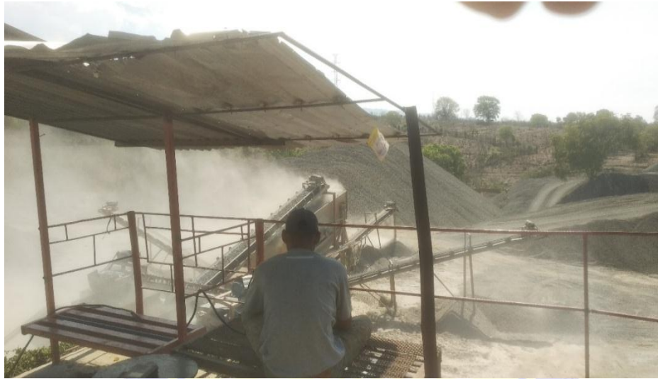
Lampiran 5 Hasil Wawancara