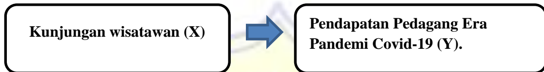
Gambar Kerangka Berpikir

kerangka berpikir dalam penelitian ini yang terlihat pada gambar sebagai berikut: